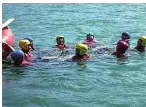
水辺の安全利用講習会

河川や河川空間を使って、観察会や、安全に河川を利用するための講習会などを実施します。