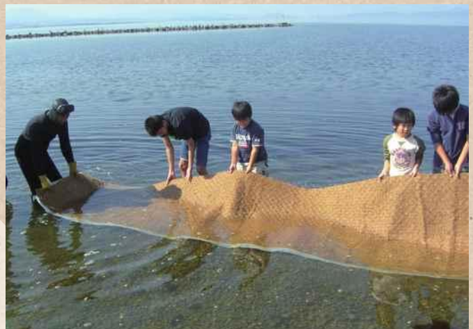
【鳥取県・島根県】中海 NPO法人 未来守りネットワーク

河川協力団体によるアマモ場再生への取り組み。作業に地域の子も達も参加することで、自分達が住む地域への関心や、自然環境に対する意識の向上につながっている。