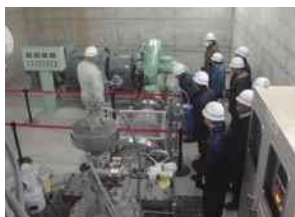
河川・ダム管理状況説明

過去の水害などの伝承や、防災に関わる活動、またダムなど河川にある施設での説明会などを実施します。