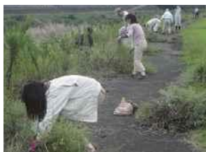
外来植物調査・駆除

水生生物の調査研究や、生態系を維持するために外来生物の駆除活動などを行い、河川の環境を維持します。