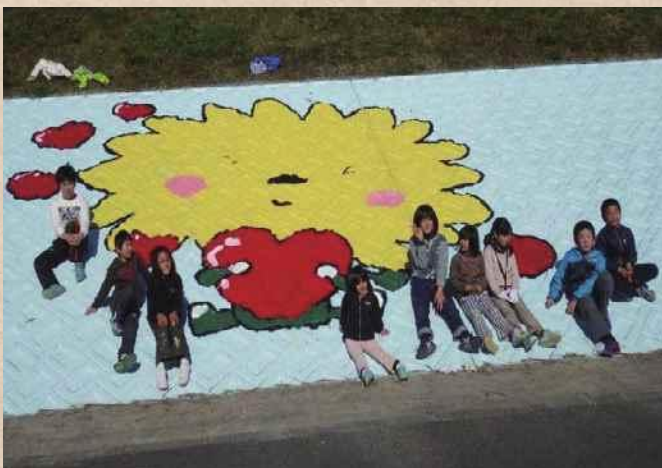
【徳島県】桑野川 横見町をきれいにする会

誰でも、いつでも気軽に近づく快適な河川空間は維持・管理が重要です。河川協力団体が実際の作業を行うにあたって、河川管理者と河川協力団体が協力して計画を作成するなど、両者が一体となって安心・安全な河川空間の維持・管理の質の向上につながっています。