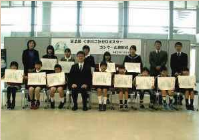
【熊本県】球磨川 次世代のためにがんばる会

河川協力団体は市民と河川管理者、双方の立場を理解し、活動しています。市民と河川管理者の間に立つことで、お互いの視点や想いを融合することが出来ます。その結果、河川の利活用や維持・管理につながります。