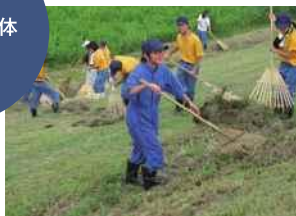
河川の除草・集草