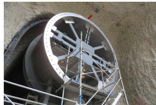
【小容量放流設備操作室(型枠設置)】 （撮影日：R8.4.30）