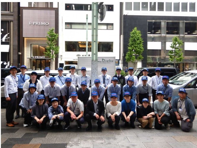
清掃に参加した東京国道職員(銀座2丁目)