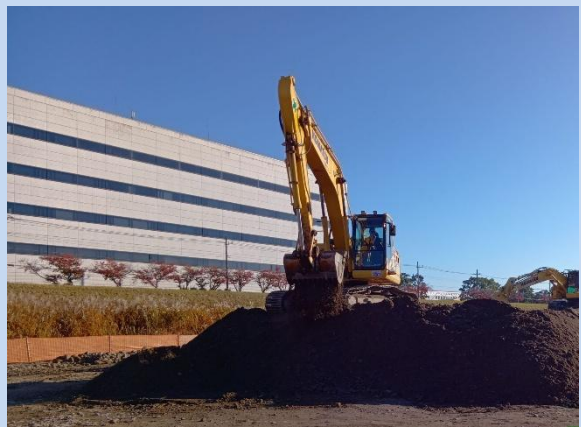
土砂のふるい分けを行っています。 (令和7年11月)