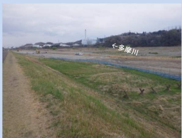
工事着手前 (令和7年3月)