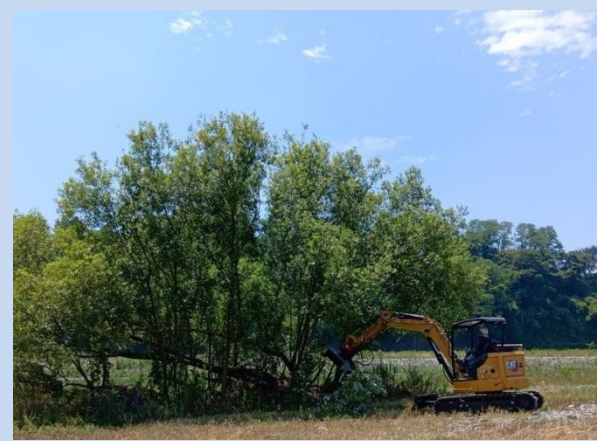
施工箇所の伐採・除草を行っています。 (令和7年8月)