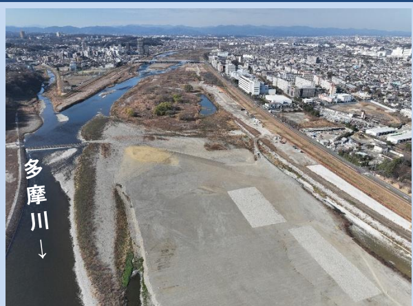
河道の掘削が完了しました。 (令和7年12月)