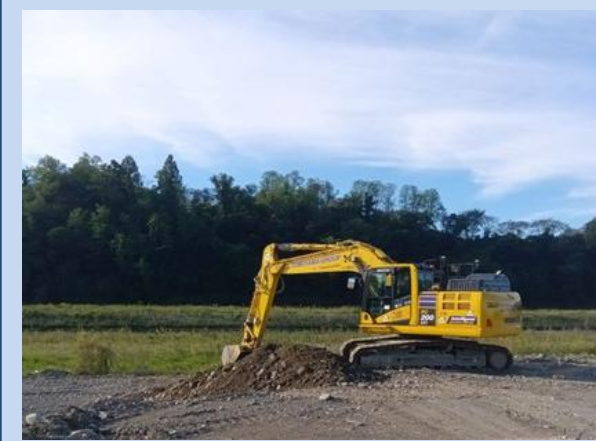
河道を掘削しています。 (令和7年9月)