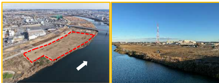
工事箇所の全景（上流から）