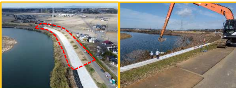
工事箇所の全景（下流から）