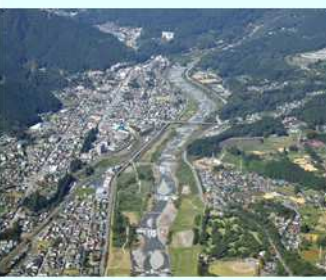
だいやがわ 大谷川床固工群

曲がりかねた川を真っ直ぐにして、川の流れを安定させ、大雨の時に川があふれないようにします。床固工(とこがためこう)と護岸工(ごんこう)が一体となって川岸や川底が削られるのを防ぎます。また、魚の生息域を保つために魚の通り道となる魚道(ぎょどう)をもうけたり、人々が川に親しめるような安らぎの空間を造っています。