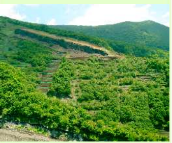
おおなぎ 大薙山腹工

崩壊した山腹をそのまま放置しておくと、土砂流出が活発化し、ますます崩壊が拡大するという悪循環が起きてしまいます。山腹工は、荒れた山肌を土留め壁や編籠・水路などをつくって斜面を安定させ、草木を植えて裸地を緑で覆い、降雨等による土砂災害を防ぐとともに、緑に満ちた森林を創出していきます。