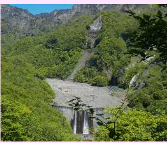
ひなた 日向砂防堰堤

豪雨や地震によって斜面崩壊や河床に堆積した土砂が再移動し、土石流となって河川を埋め洪水氾濫を引き起こしたり、住宅や道路を壊すなど、下流に大きな被害をもたらします。砂防堰堤はこうした土石流による災害を防ぐために荒廃した渓流に建設されます。