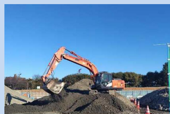
土砂のふるい分けを行っています。 (令和8年1月)