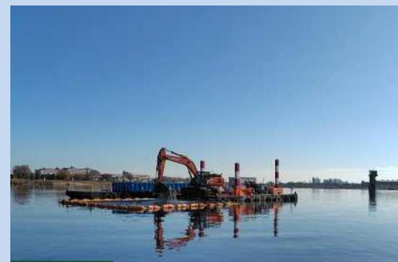
浚渫を行っています。 (令和7年12月)