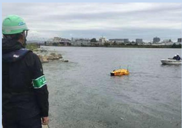
工事に入る準備をしています。 (令和7年10月)