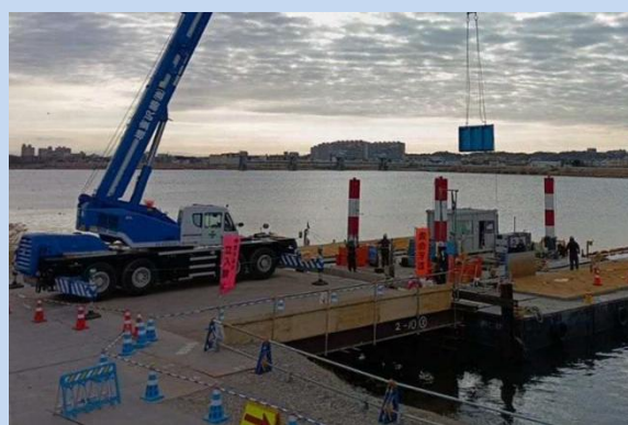
台船を解体しています。 (令和8年2月)