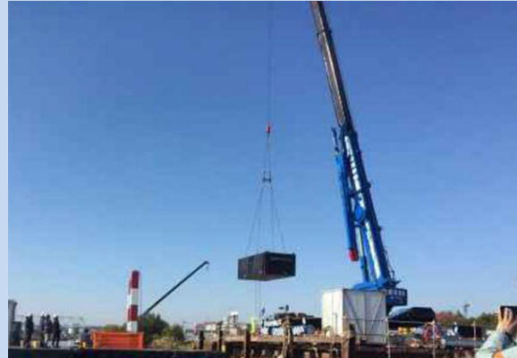
作業船の組立を行っています。 (令和7年11月)