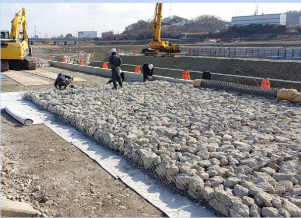
かごマットを設置しています。 (令和8年1月)