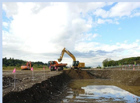
床掘りを行っています。 (令和7年10月)