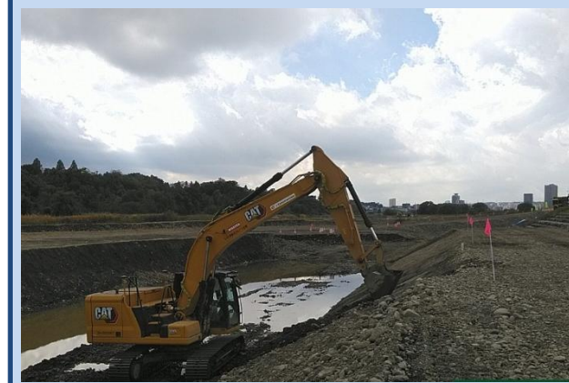
法面を整形しています。 (令和7年11月)