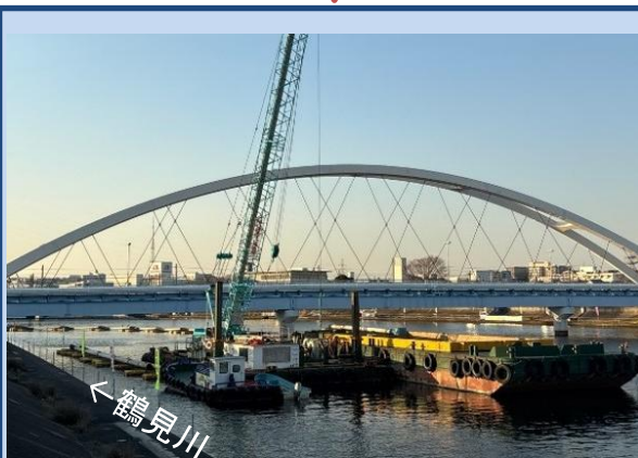
浚渫を行っています。 (令和8年1月)