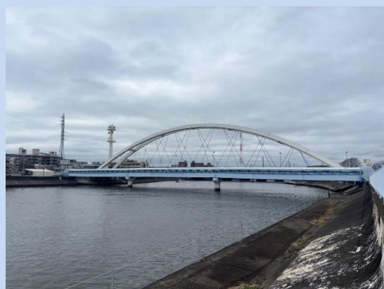
工事が完了しました。 (令和8年2月)