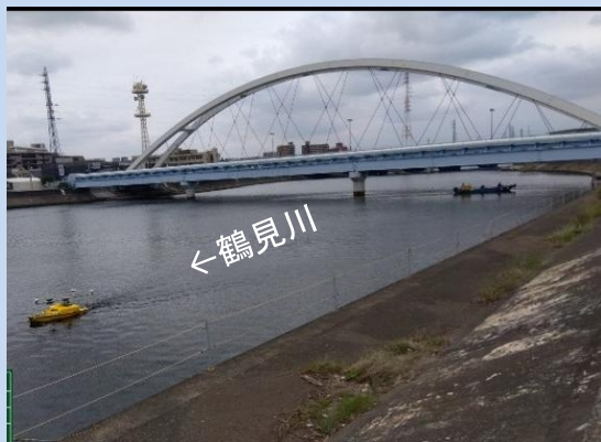
工事に入るための準備をしています。 (令和7年10月)