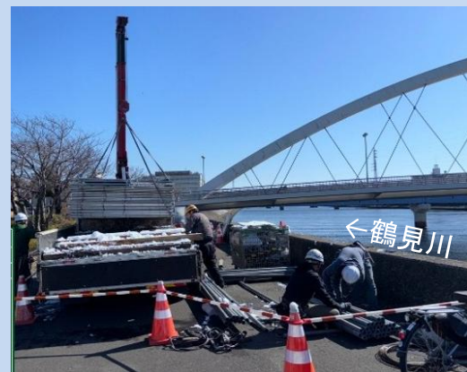
浚渫が完了し、仮設を撤去しました。 (令和8年2月)