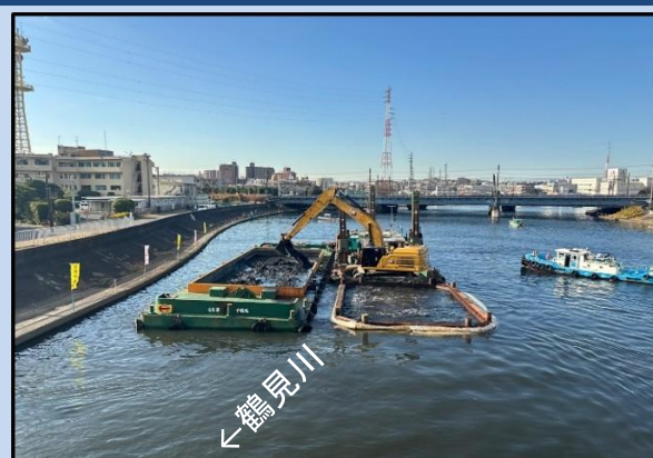
浚渫を行っています。 (令和7年12月)