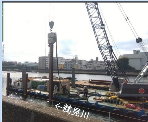
浚渫船が係留するための杭を 設置しています。(令和7年11月)