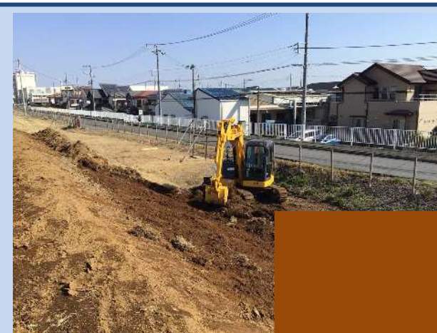
堤防を整備しています。 (令和8年3月)