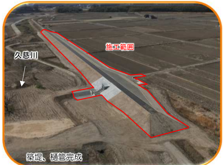
① 常陸大宮市 小貫南地区

■ソフト施策 ・越水・決壊を検知する機器の開発・整備 ・危機管理型水位計、簡易型河川監視カメラの設置 ・ダム操作状況の情報発信 ・台風第19号の課題を受けたタイムラインの改善 ・講習会等によるマイ・タイムライン普及促進 ・防災メール、防災行政無線等を活用した情報発信の強化 ・要配慮者利用施設の避難確保計画作成の促進 ・緊急排水作業の準備計画策定と訓練実施 等