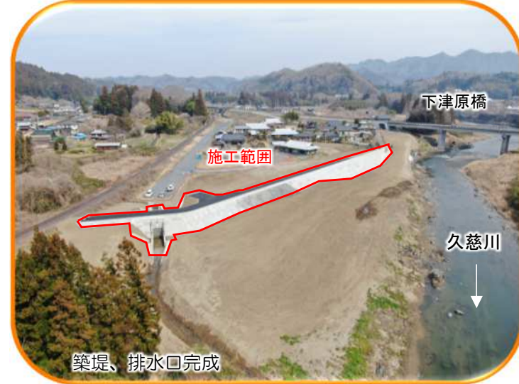
⑪ 大子町 下津原地区