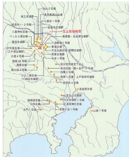
生出塚窯産埴輪の分布