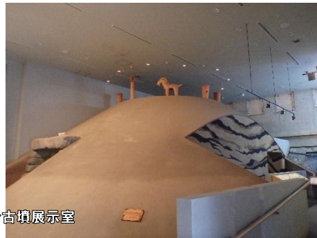
多摩川台古墳展示室