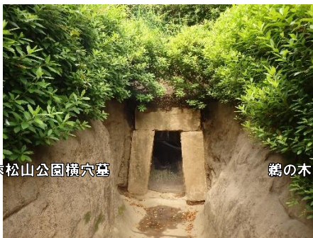
鶉の木松山公園横穴墓