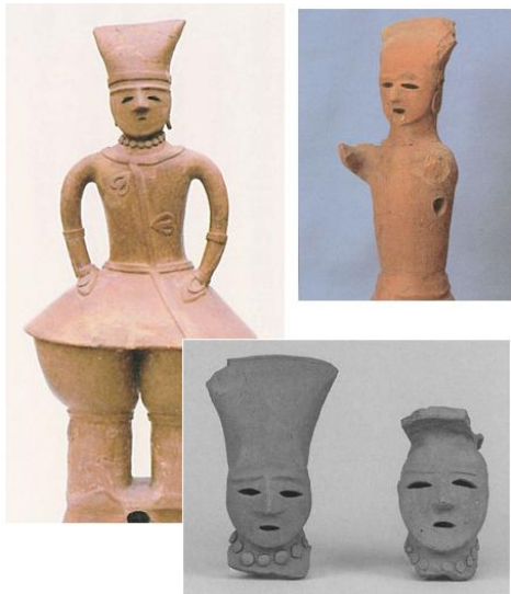
出土した頭巾をかぶる人物埴輪