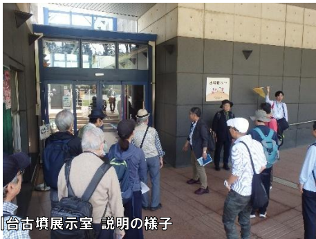
多摩川台古墳展示室 説明の様子

大田区から世田谷区にまたがる荏原台古墳群内のうち、太田区域の田園調布古墳群で出土した大刀や勾玉、埴輪などのレプリカが展示されています。