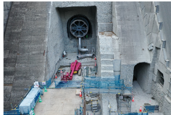
【小容量放流設備操作室工(Co打設)】 【撮影日 : R8.3.30】