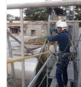
【墜落制止用器具の使用】