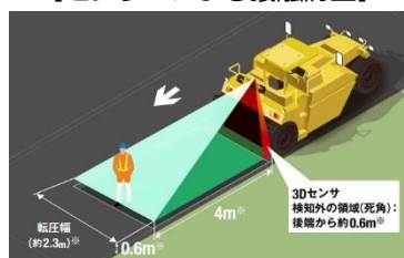
【センサーによる接触防止】