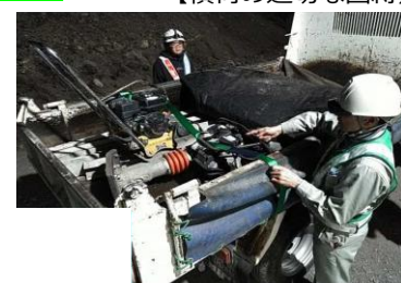
【積荷の適切な固縛】