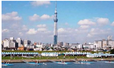
国民体育大会ボート競技の様子（平成25年）

人が水辺に近づけ、街と河川の一体性が向上されるよう、階段式護岸の整備を実施（平成21～25年）。