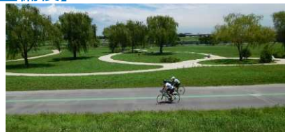
整備された「新田わくわく水辺広場」