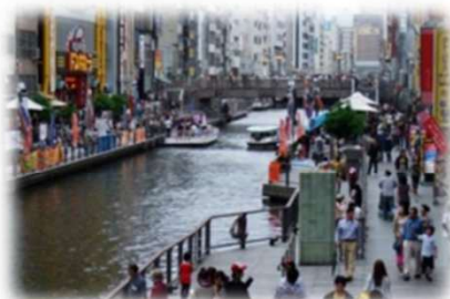
遊歩道の民間活用 (道頓堀川/大阪市)