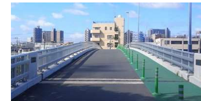
整備された新志茂橋