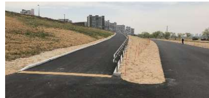
整備されたアクセススロープ

国土交通省によるアクセススロープ整備と足立区による河川敷公園・駐車場整備により、河川敷の利便性向上を行った（平成21～29年）。