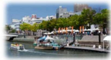
親水護岸の利用 (新町川/徳島市)