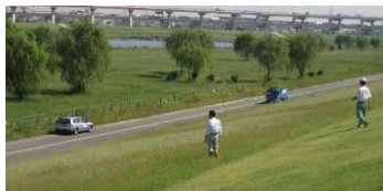
都民ゴルフ場として利用