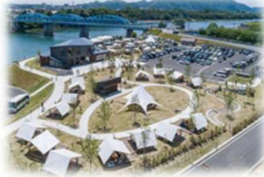
賑わい拠点の整備 (木曾川/美濃加茂市)