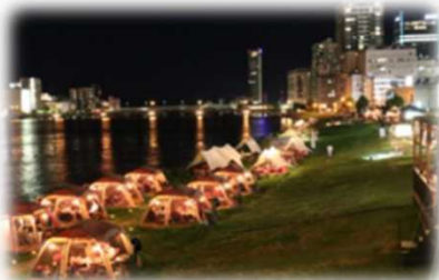
民間事業者の参加 (信濃川/新潟市)