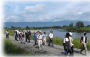
河川管理用通路の利用 (最上川/長井市)