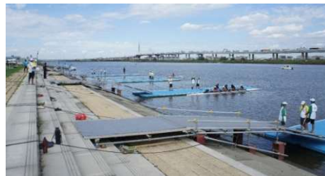
レガッタ教室の様子

人が水辺に近づけ、街と河川の一体性が向上されるよう、階段式護岸の整備を実施（平成21～25年）。