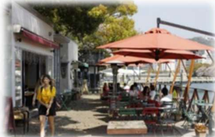
オープンカフェの設置 (京橋川/広島市)