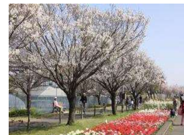
よみがえった五色桜

国土交通省による側帯の整備と足立区による桜の植樹等を行い、桜堤の整備を実施（平成21～29年）。