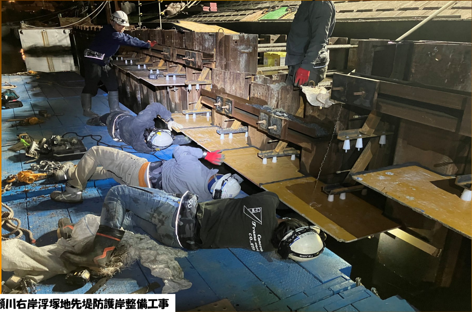
R6綾瀬川右岸浮塚地先堤防護岸整備工事