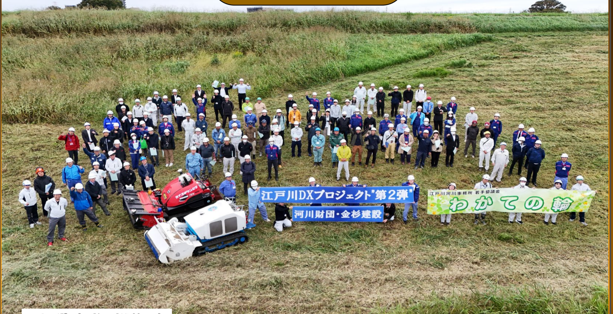
R7三郷・吉川河川維持工事