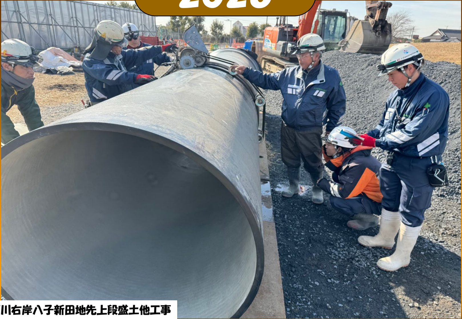
R6江戸川右岸八子新田地先上段盛土他工事