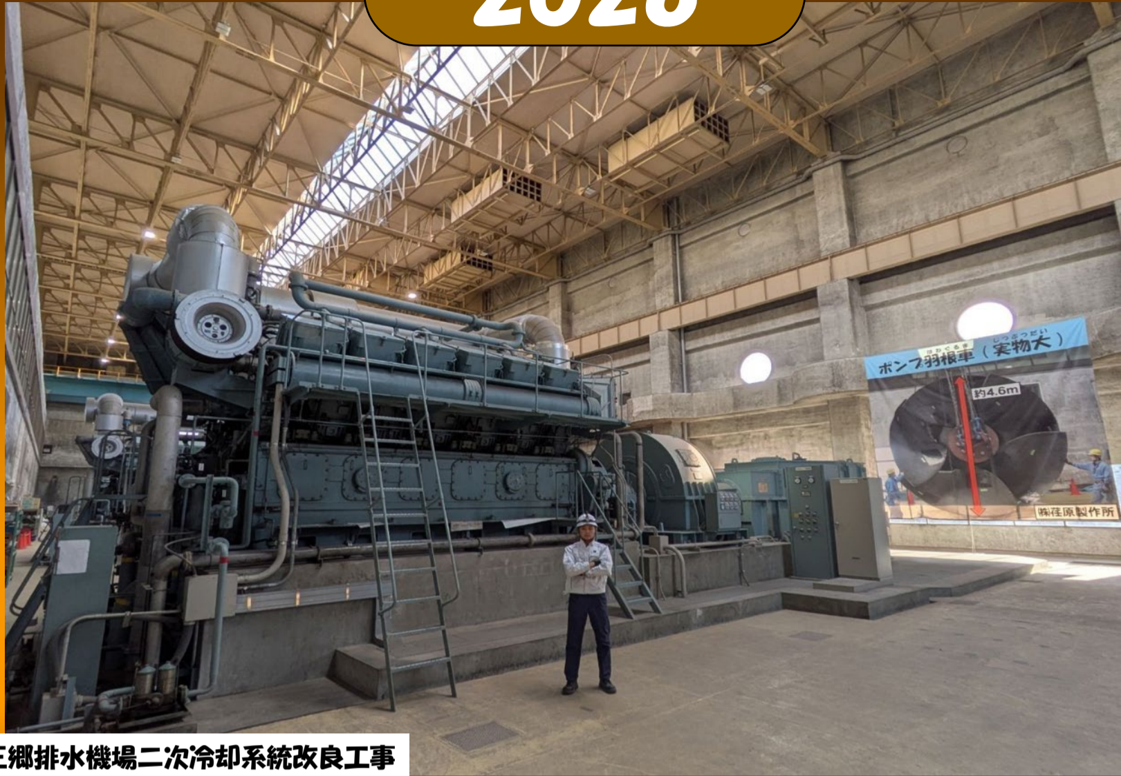
R5三郷排水機場二次冷却系統改良工事