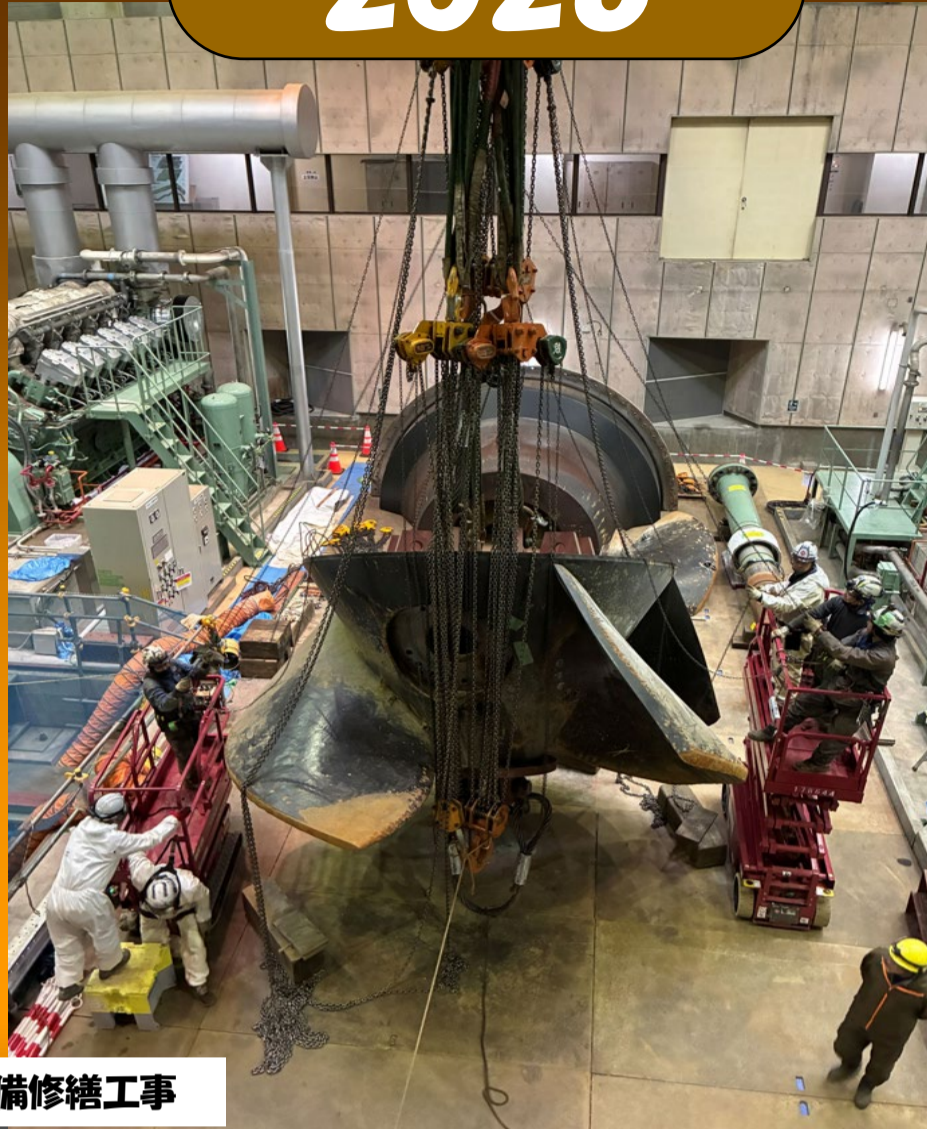
R6松戸排水機場ポンプ設備修繕工事