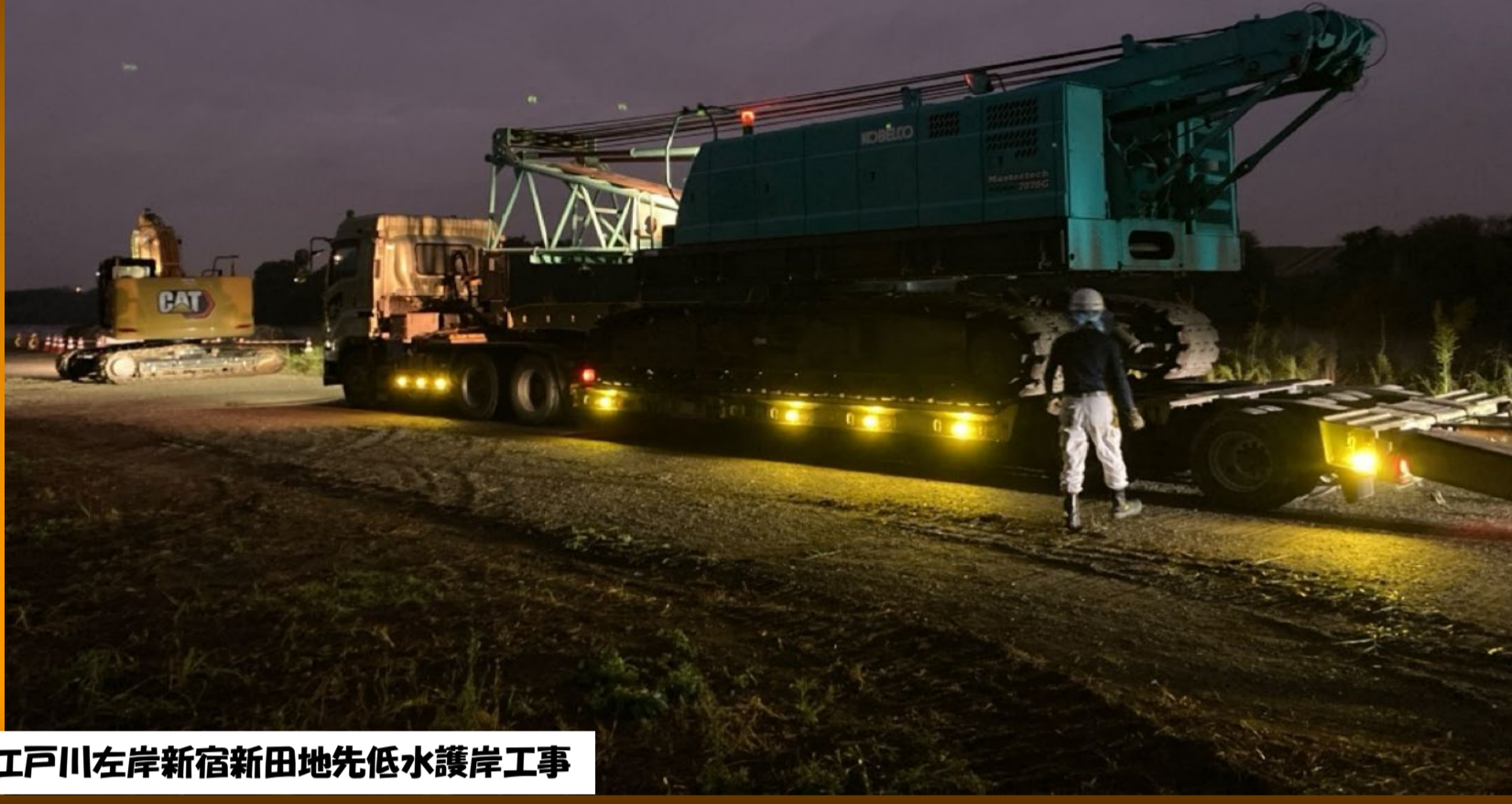
R6江戸川左岸新宿新田地先低水護岸工事