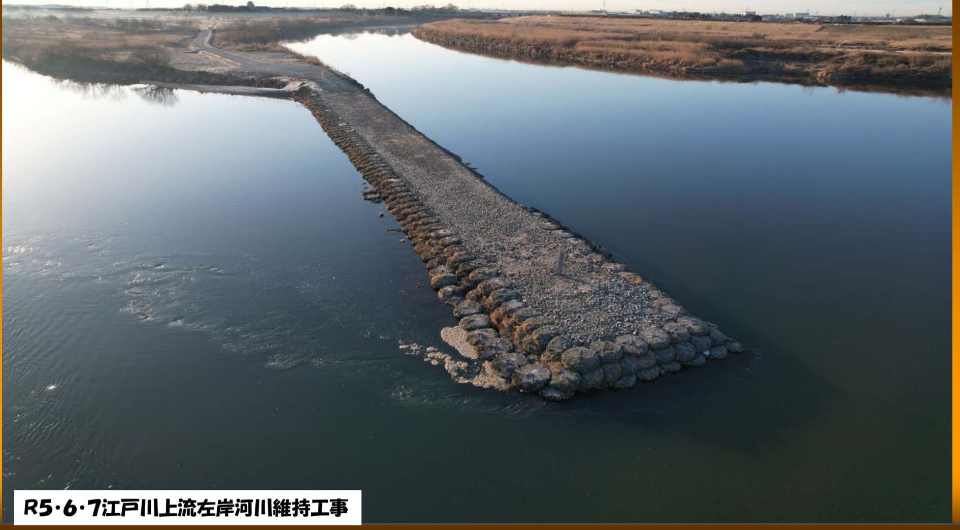
R5・6・7江戸川上流左岸河川維持工事