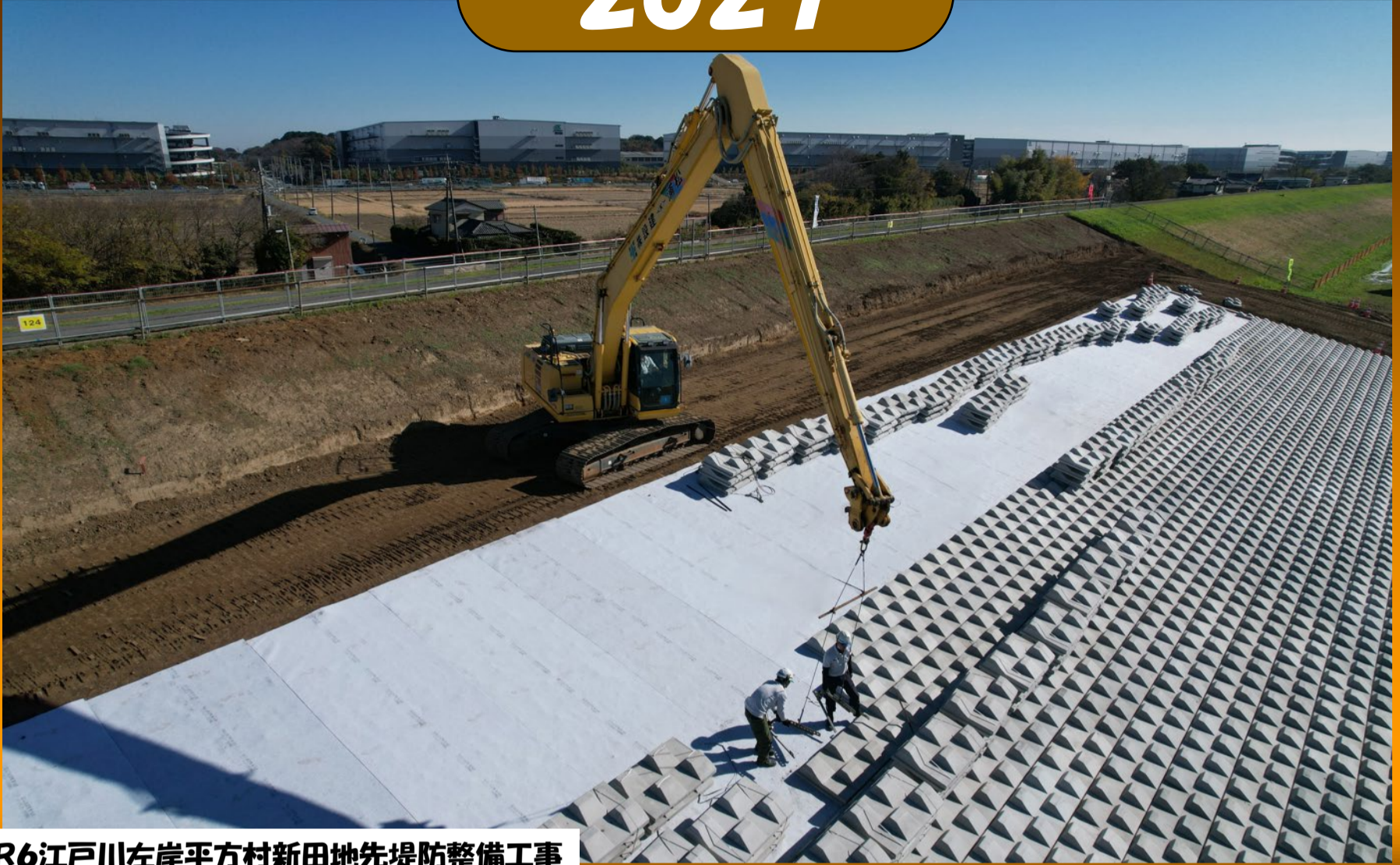
R6江戸川左岸平方村新田地先堤防整備工事