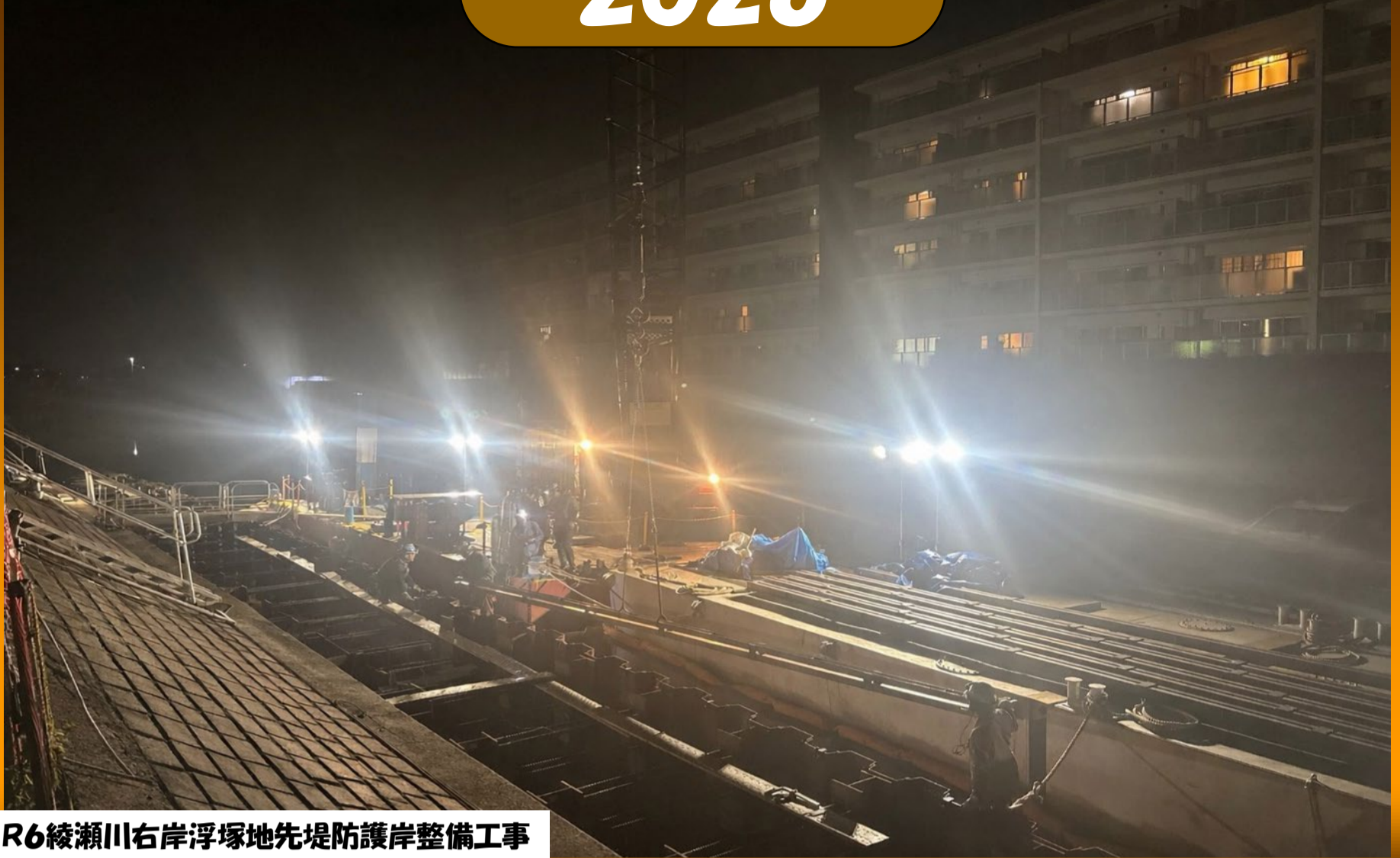
R6綾瀬川右岸浮塚地先堤防護岸整備工事