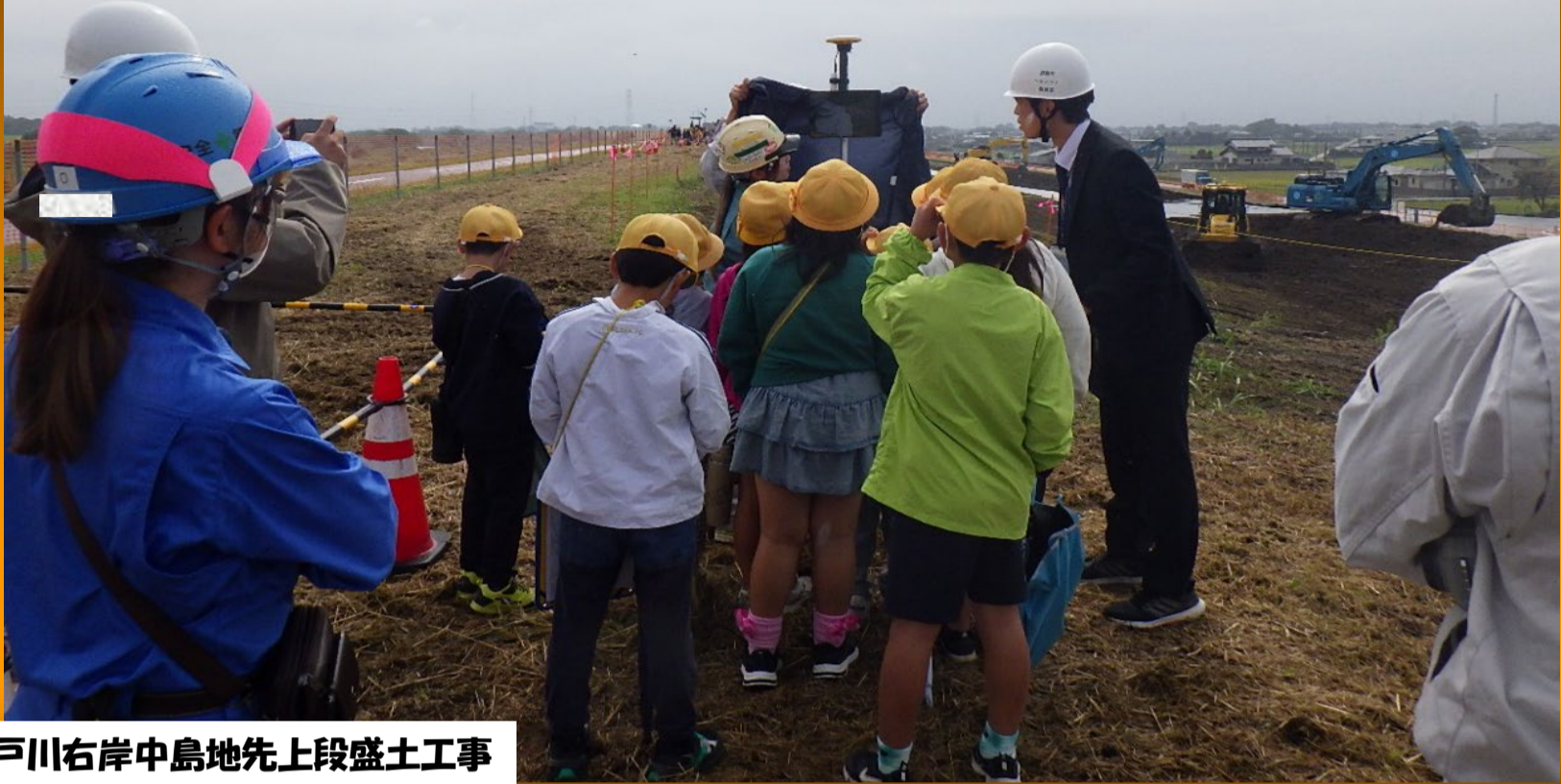
R6江戸川右岸中島地先上段盛土工事