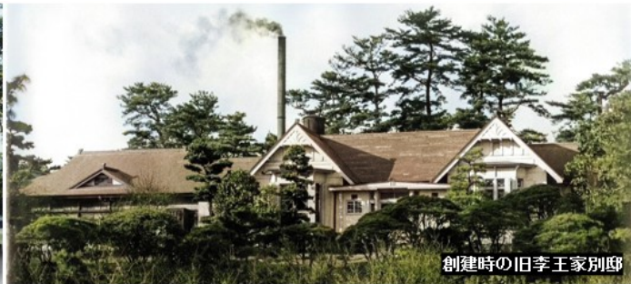
創建時の旧李王家別邸