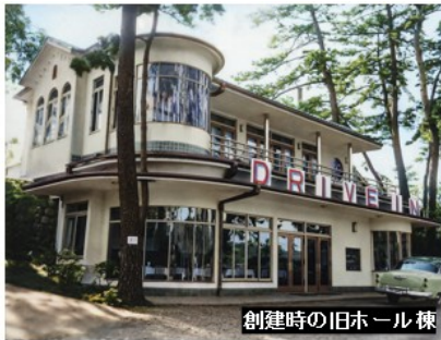
創建時の旧ホール棟

いよいよ工事も大詰めを迎え、“今”しか見ることのできない歴史的建造物の保存・活用に向けた工事現場を、是非体感してください！