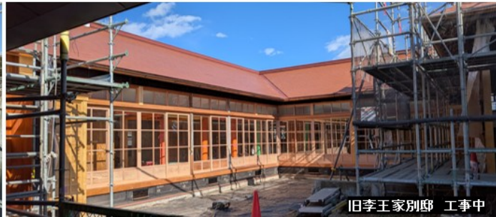
旧李王家別邸 工事中