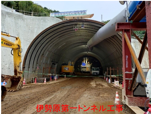
伊勢原第一トンネル工事

現在掘削を行っている、厚木秦野道路 伊勢原第一トンネル工事の現場をご案内します。また、近傍にある埋蔵文化財調査地※の視察ができます。 ※埋蔵文化財調査については、公益財団法人かながわ考古学財団との共同案内。時期により案内不可となる場合あり