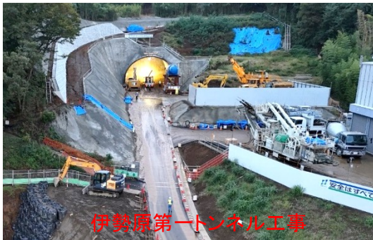
伊勢原第一トンネル工事