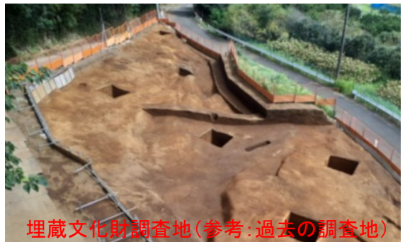
埋蔵文化財調査地(参考:過去の調査地)