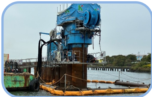
鋼管矢板圧入(水上施工)状況