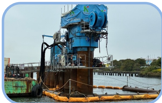
鋼管矢板圧入(水上施工)状況