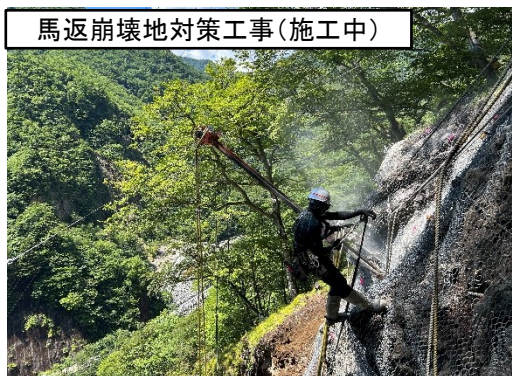
馬返崩壊地対策工事(施工中)