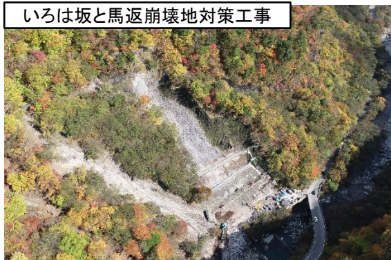
いろは坂と馬返崩壊地対策工事