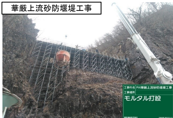
華厳上流砂防堰堤工事