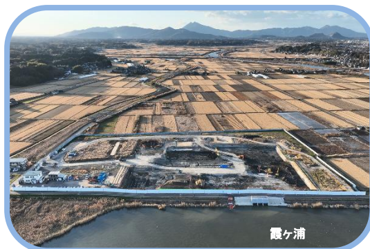
高浜機場の工事現場