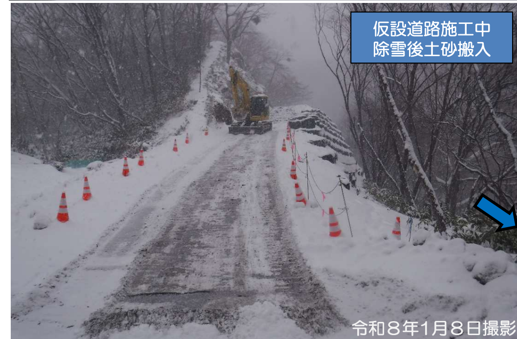
仮設道路施工中 除雪後土砂搬入