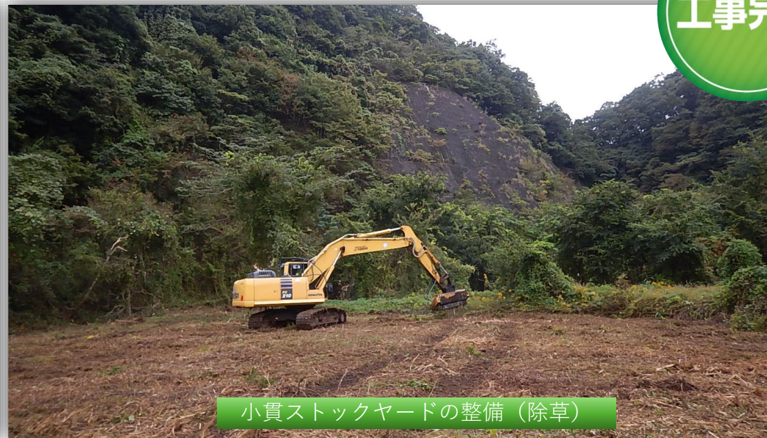
小貫ストックヤードの整備（除草）