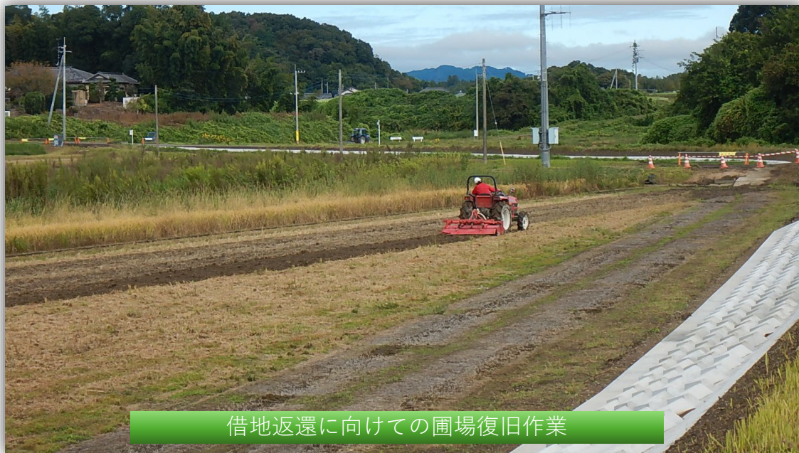
借地返還に向けての圃場復旧作業