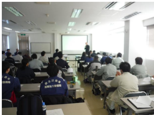
NPO法人油濁防除研究会による座学