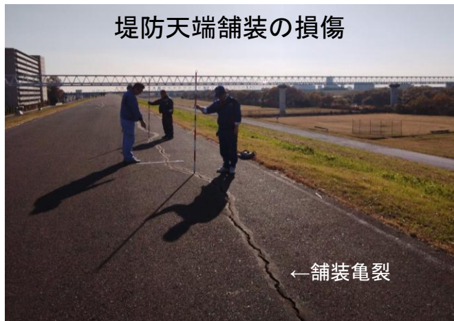
堤防天端舗装の損傷

点検の結果、確認された堤防の異常については緊急性に応じて順次補修等の対応を行っていく予定です。