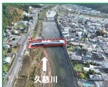
工事箇所の全景（上流から）

R5久慈川大子地先松沼橋上部工新設工事／川田建設株式会社 大子町大子地先/久慈川右岸62.6k付近 (R7.11月撮影)