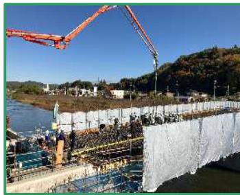
コンクリートの打設作業を行っています