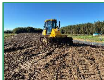
堤防盛土の工事を行っています