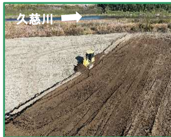
押土により土砂の集積を行っています