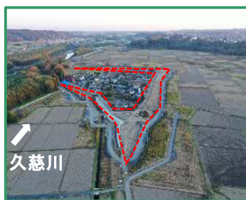
工事箇所の全景（上流から）