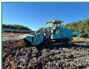
築堤材に使用する土砂を改良をしています