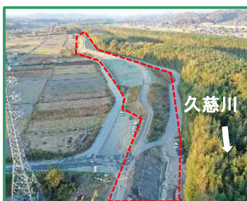
工事箇所の全景（下流から）

R5久慈川右岸高渡地区整備工事／株式会社 森本組 常陸大宮市高渡町地先/久慈川右岸26.5k付近 (R7.11月撮影)