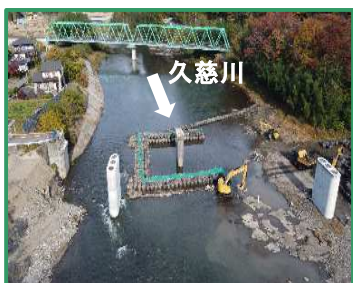
工事箇所の全景（下流から）

R6久慈川右岸南田気橋下部工新設工事／株式会社 梅原工務店 大子町南田気地先/久慈川右岸59.0k付近 (R7.11月撮影)