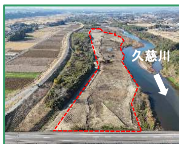
工事箇所の全景（下流から）

R6久慈川常陸太田周辺整備工事／株式会社 鶴田組 那珂市門部地先/久慈川右岸16.5k付近 (R7.11月撮影)