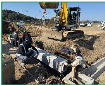
暗渠の布設作業を行っています