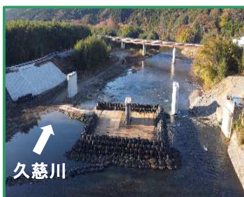
工事箇所の全景（上流から）