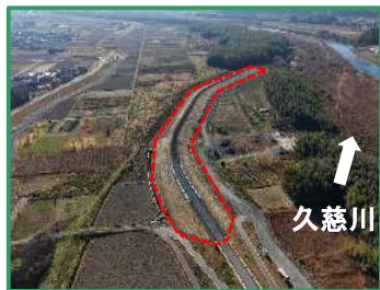
工事箇所全景（上流から）