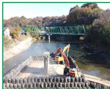
旧橋脚の解体作業を行っています