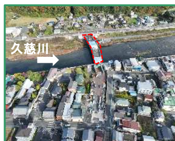
工事箇所の全景（右岸から）