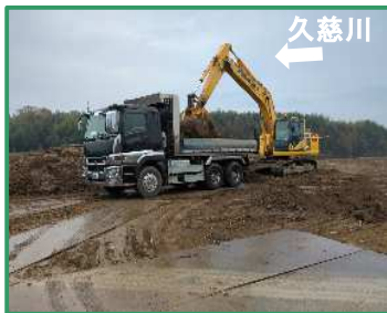
掘削土の積み込みを行っています

R5久慈川右岸高渡地区整備工事／株式会社 森本組 常陸大宮市高渡町地先/久慈川右岸26.5k付近 (R7.11月撮影)