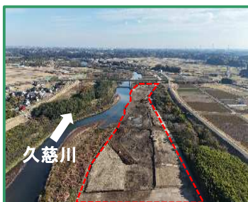
工事箇所の全景（上流から）