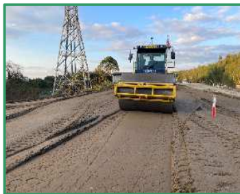
築堤のための転圧作業を行っています

R6久慈川右岸南田気橋下部工新設工事／株式会社 梅原工務店 大子町南田気地先/久慈川右岸59.0k付近 (R7.11月撮影)