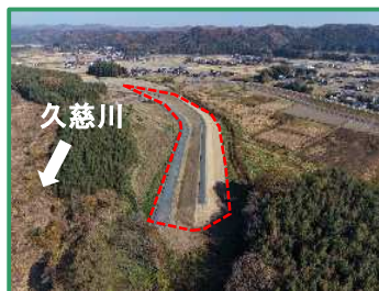
工事箇所全景（下流から）