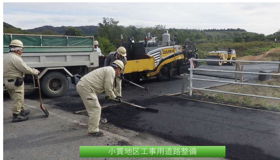
小貫地区工事用道路整備