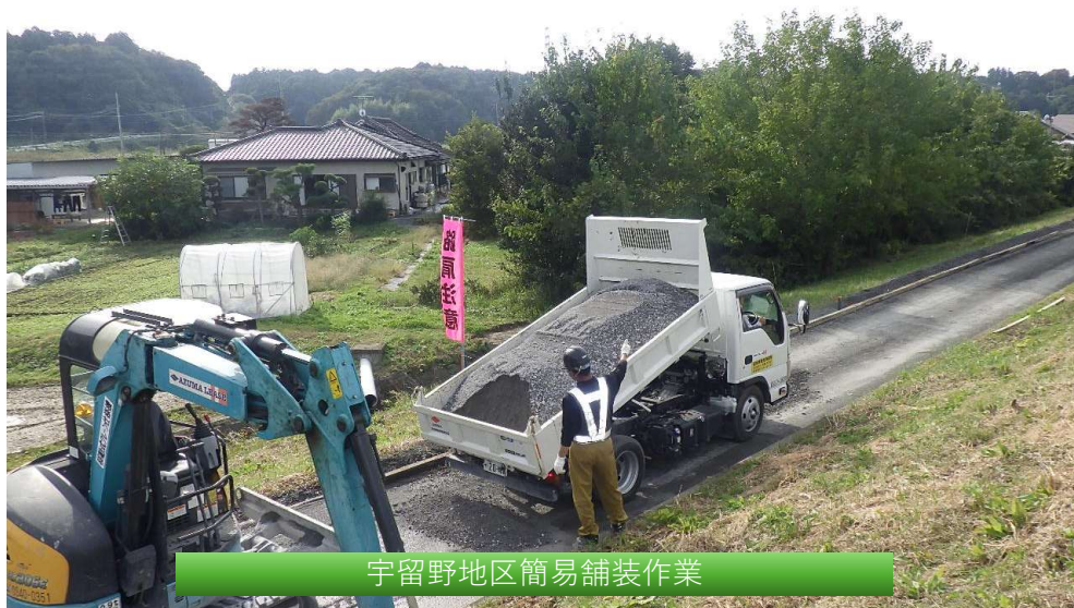
宇留野地区簡易舗装作業