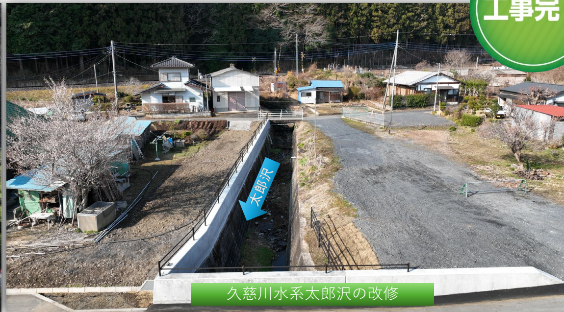
久慈川水系太郎沢の改修