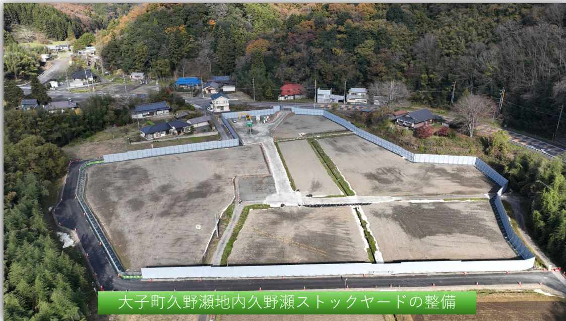
大子町久野瀬地内久野瀬ストックヤードの整備