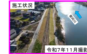
(b) ひたちなか市勝田地区（那珂川左岸4.0k付近）