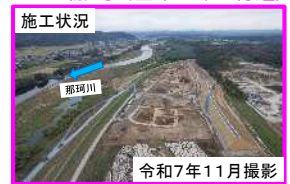
(f) 常陸大宮市大場地区（那珂川左岸34.5k付近）