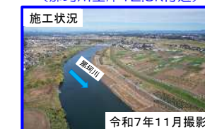
④ 水戸市中河内地区（那珂川左岸15.0k付近）