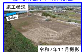
⑥ 水戸市下国井地区（那珂川左岸19.0k付近）