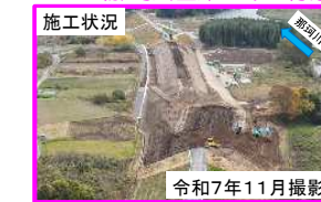
(g) 常陸大宮市野口地区（那珂川左岸39.0k付近）