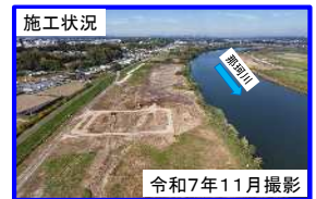
③ 水戸市根本地区（那珂川右岸14.0k付近）