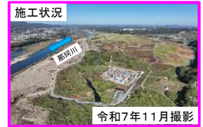
(f) 常陸大宮市大場地区（那珂川左岸31.5k付近）