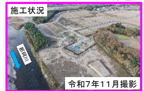
(i) 那須烏山市下境地区（那珂川左岸61.0k付近）