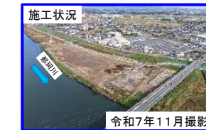
② 水戸市水府地区（那珂川左岸12.5k付近）