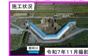
(f) 常陸大宮市大場地区（那珂川左岸33.5k付近）