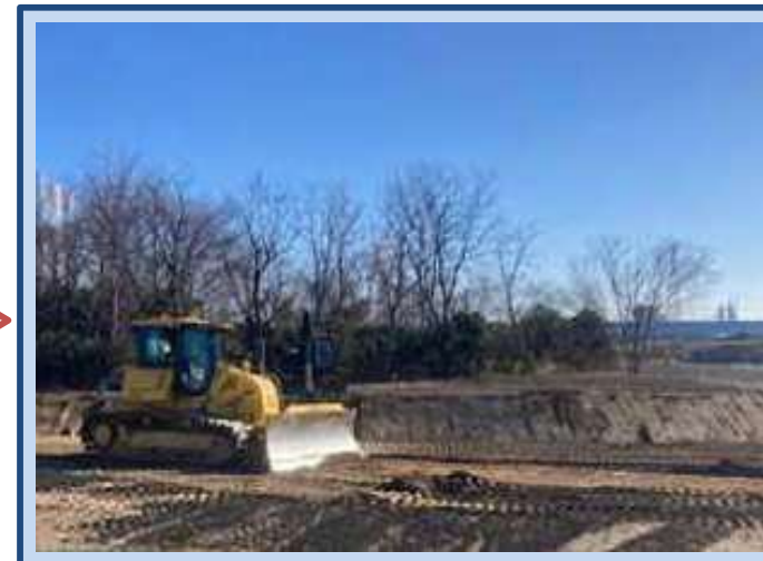
河道を掘削しています。 (令和8年1月)