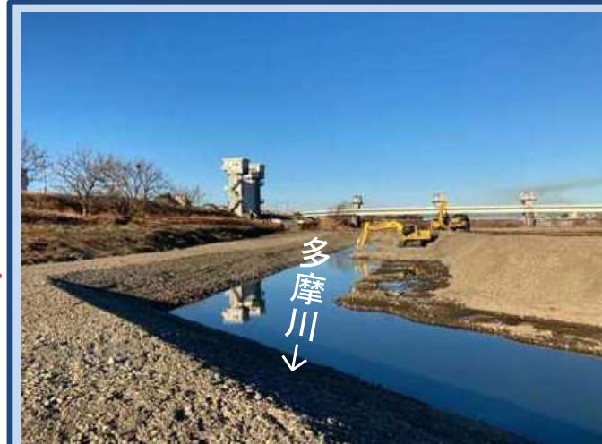
河道を掘削しています。 (令和8年1月)