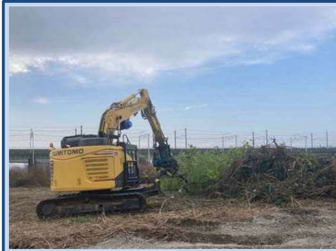
除草をしています。 (令和7年12月)