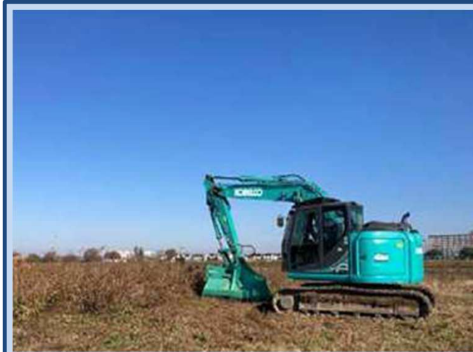
除草をしています。 (令和7年12月)