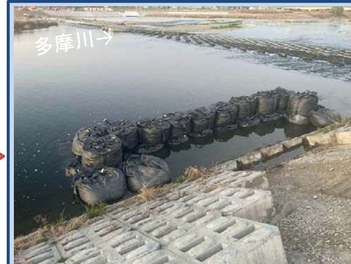
水路を設置するため仮締切を設置しています。 (令和7年12月)