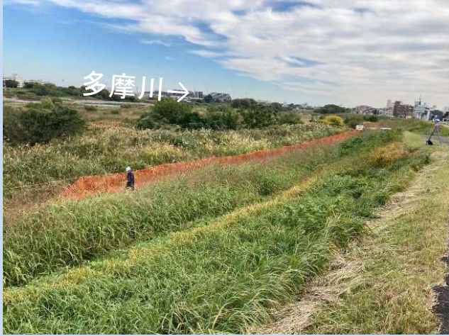
工事に入る準備をしています。 (令和7年11月)