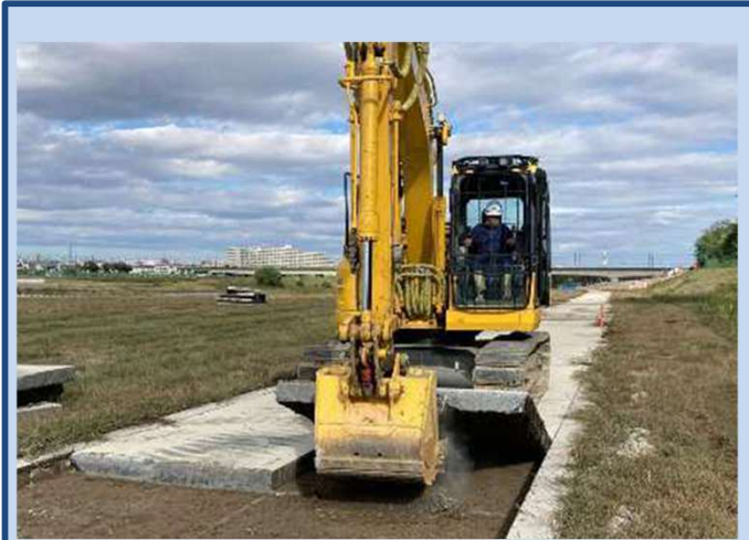
工事に入る準備をしています。 (令和7年10月)