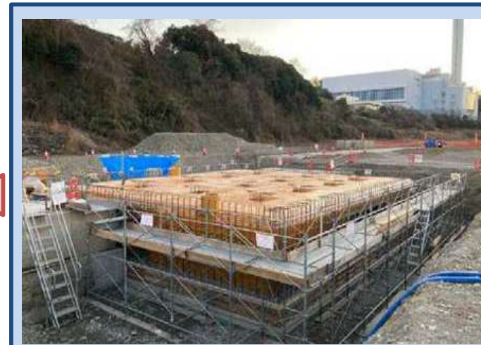
水路を作成するための型枠を組み立てています。 (令和8年1月)