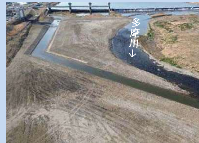
河道の掘削が完了しました。 (令和8年2月)