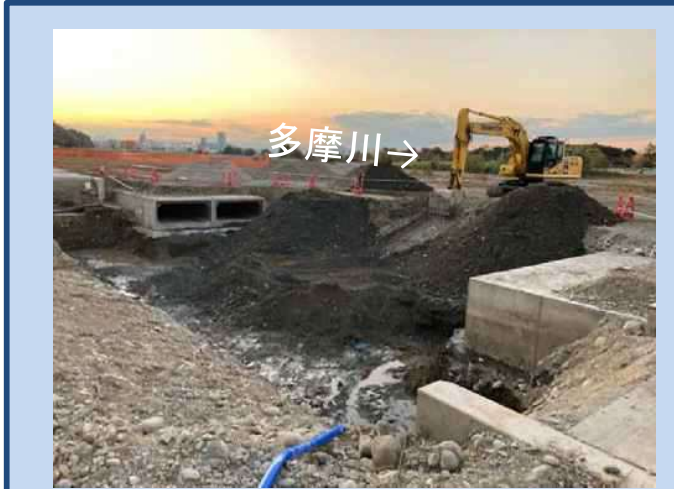
水路を設置するため掘削しています。 (令和7年11月)