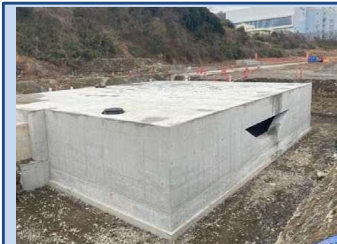
水路を作成しました。 (令和8年2月)