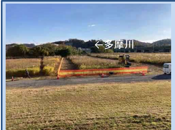
工事に入る準備をしています。 (令和7年11月)