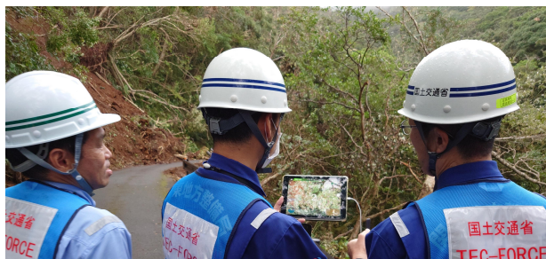
ドローンで上空より被災状況を調査

本日より被災状況調査班(道路⑦、⑧)、及び被災状況調査班(ドローン班③)が現地調査を開始しております。