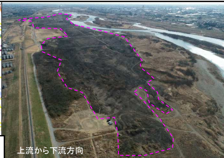
上流から下流方向