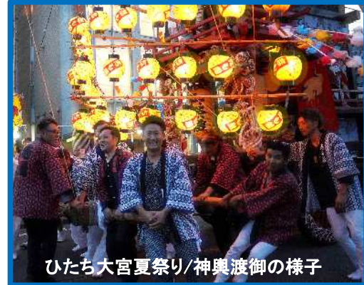
ひたち大宮夏祭り/神輿渡御の様子