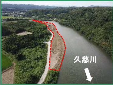
工事箇所の全景 (下流から)

R6久慈川常陸大宮周辺整備工事／株式会社 高野工務店 常陸大宮市小貫地先／久慈川左岸32.6k付近 (R7.7月撮影)