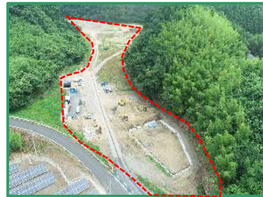
工事箇所の全景 (小貫SY)