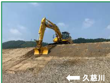
法面の整形を行っています