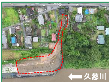
工事箇所の全景 (真上から)

R6久慈川土砂改良(その2)工事／松崎建設株式会社 常陸大宮市若林地先／(若林ストックヤード) (R7.7月撮影)