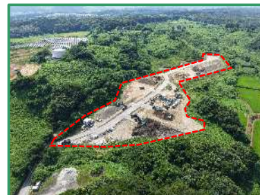
ストックヤードの全景 (下流から)