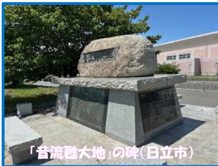
「昔流甦大地」の碑(日立市)