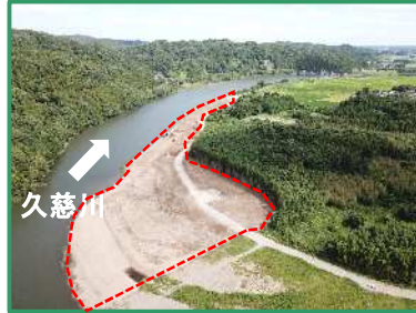
工事箇所の全景 (上流から)