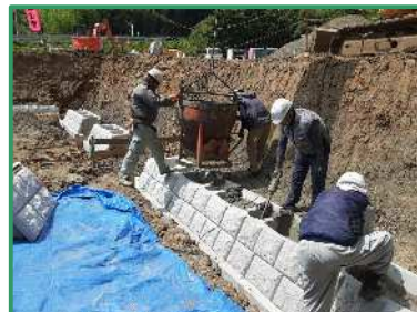
ブロック積を行っています