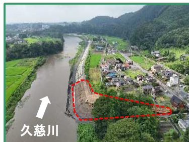
工事箇所の全景 (上流から)