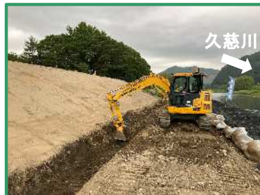
護岸基礎の床掘りを行っています