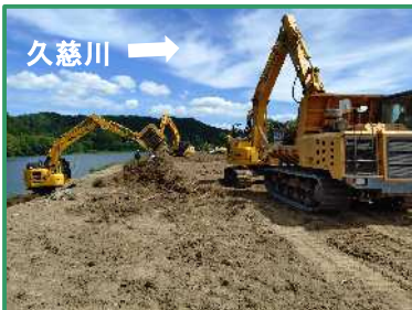
伐採作業を行っています