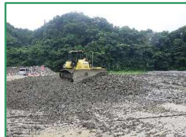
押土作業を行っています

R5久慈川右岸関沢川合流部築堤工事／北都建設工業株式会社 常陸大宮市舟生地先／久慈川右岸39.0k付近 (R7.7月撮影)