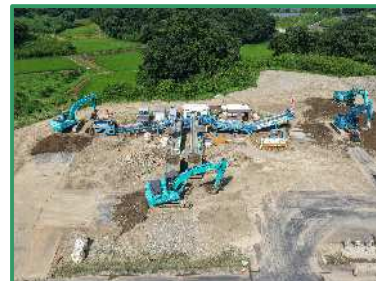
土砂改良を行っています