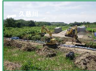
進入路の造成を行っています