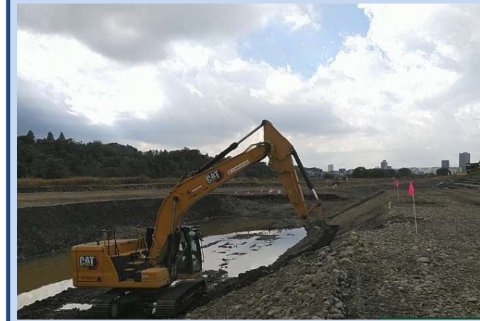
法面を整形しています。 (令和7年11月)