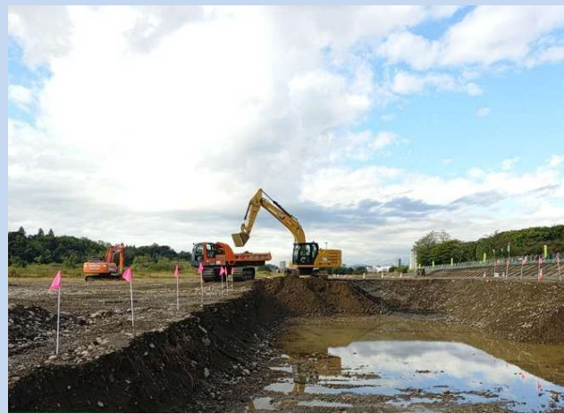
床掘りを行っています。 (令和7年10月)