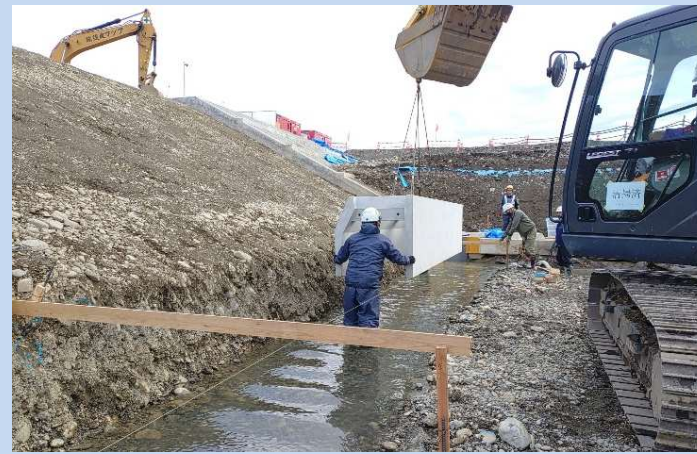
ブロックの据付をしています。 (令和7年12月)