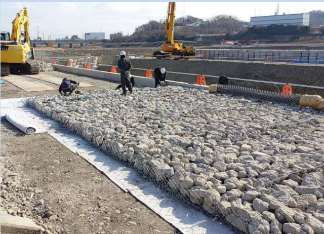
かごマットを設置しています。 (令和8年1月)