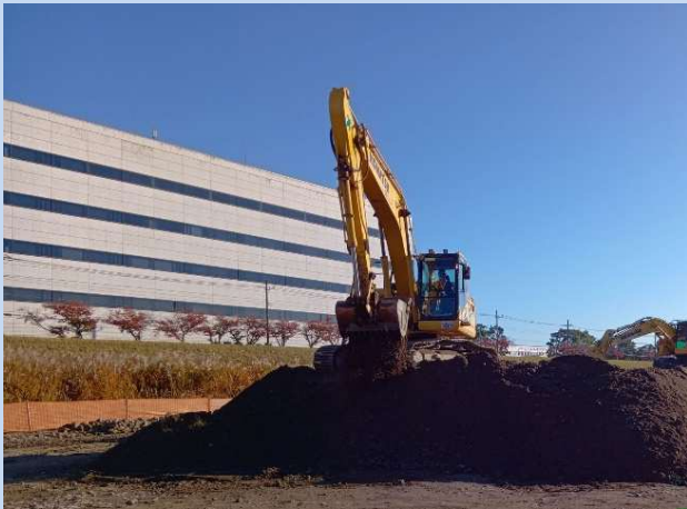
土砂のふるい分けを行っています。 (令和7年11月)