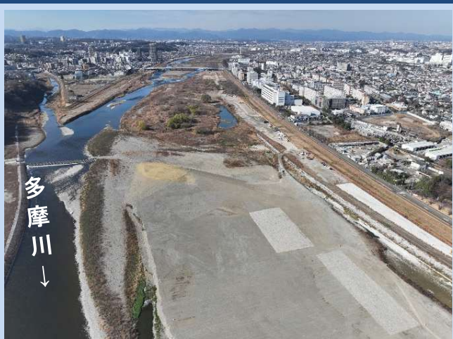
河道の掘削が完了しました。 (令和7年12月)