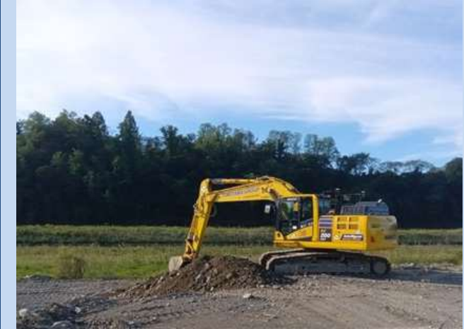
河道を掘削しています。 (令和7年9月)