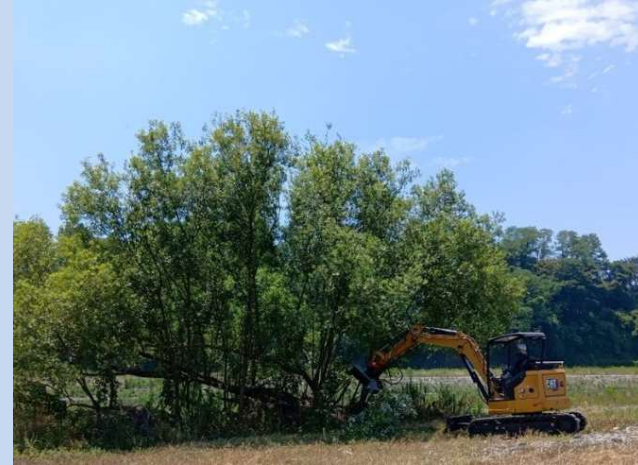
施工箇所の伐採・除草を行っています。 (令和7年8月)