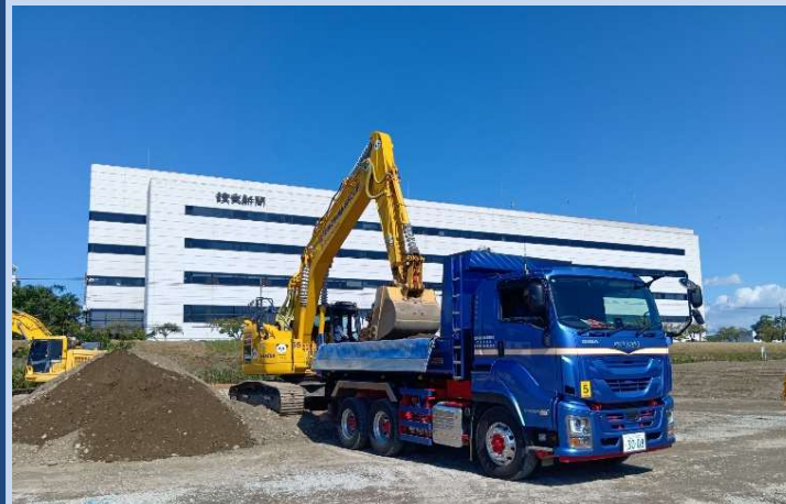
土砂のふるい分け、運搬をしています。 (令和7年10月)