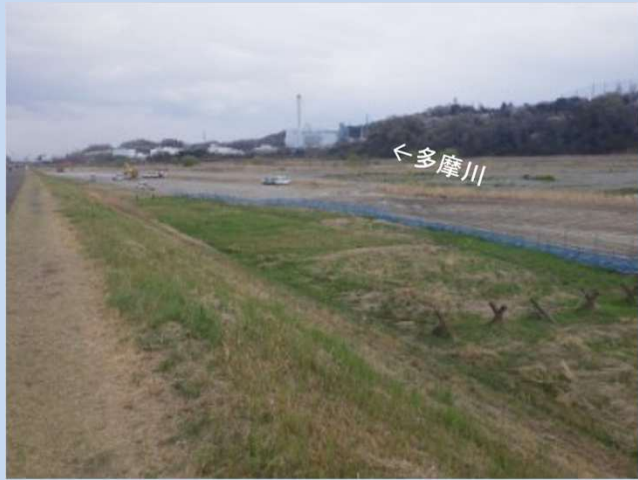
工事着手前 (令和7年3月)