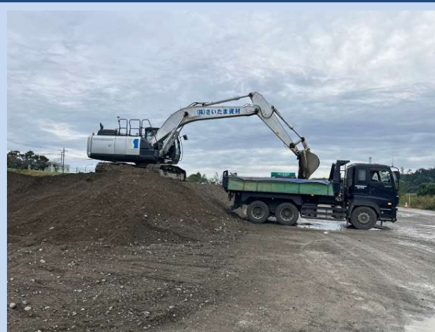
土砂の運搬を行っています。 (令和7年10月)