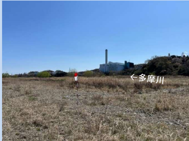
工事着手前 (令和7年3月)