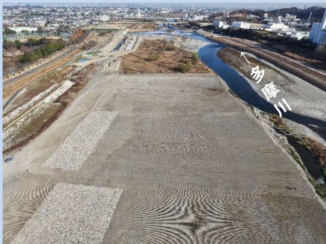
河道の掘削が完了しました。 (令和7年12月)