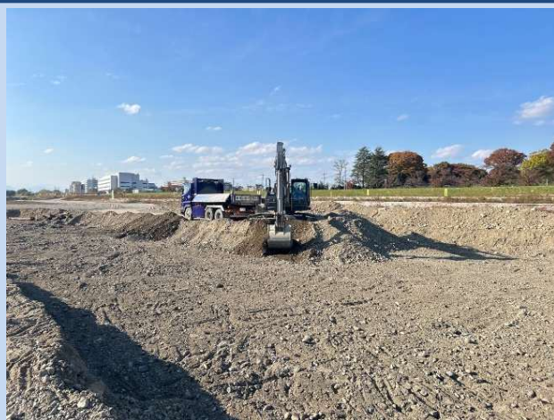
土砂の運搬を行っています。 (令和7年11月)