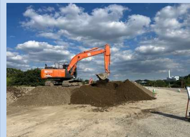
土砂のふるい分けを行っています。 (令和7年9月)