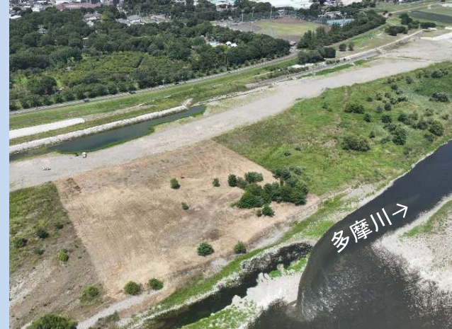
施工箇所の伐採・除草を行っています。 (令和7年7月)