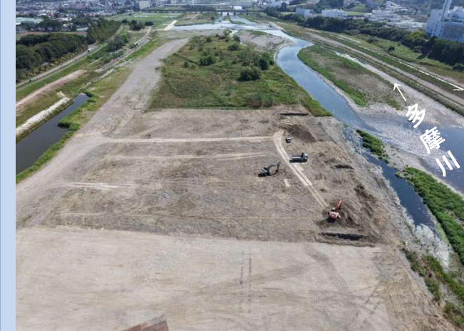
河道を掘削しています。 (令和7年8月)