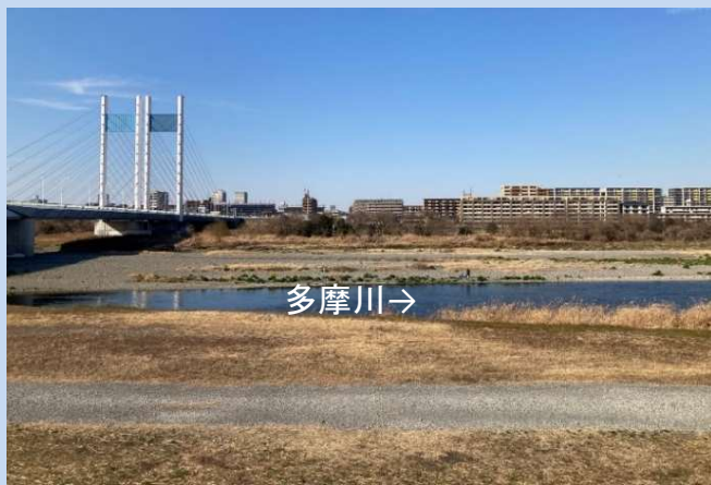
工事着手前 (令和7年3月)