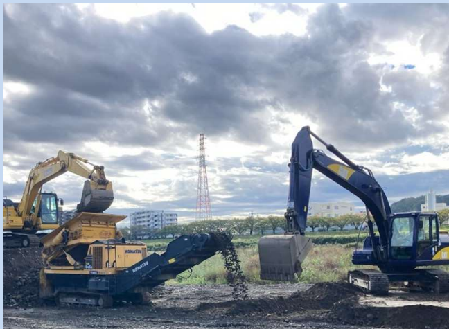
河道の掘削、土砂のふるい分けを行っています。 (令和7年10月)