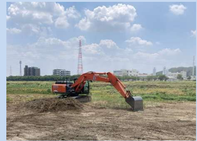
表土剥ぎ取りを行っています。 (令和7年8月)