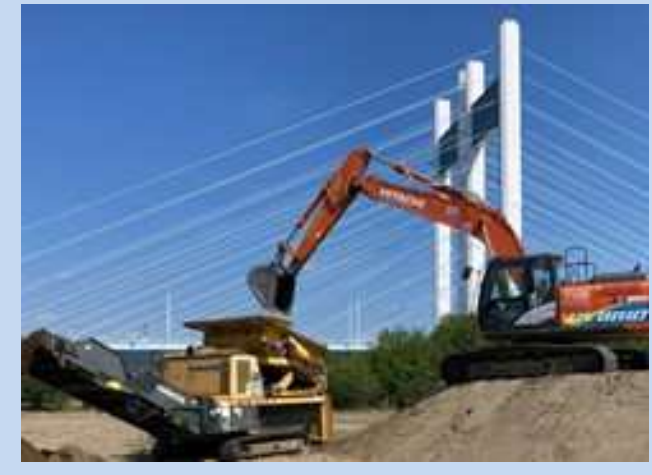
土砂のふるい分けを行っています。 (令和7年9月)