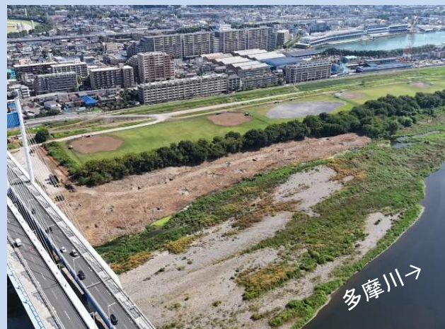
施工箇所の樹木伐採を行っています。 (令和7年7月)