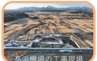
高浜機場の工事現場