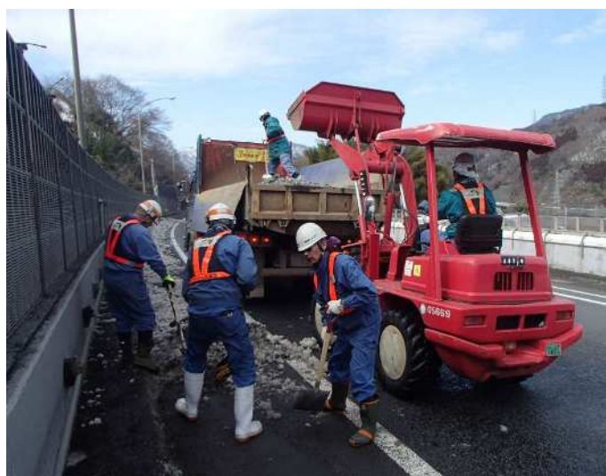
●降雪が収まっても、路面に雪が残らないよう排雪をする必要があります