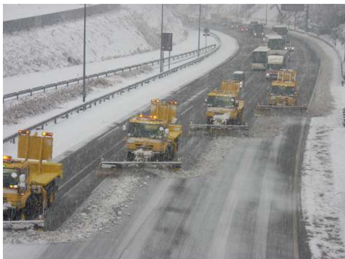
●除雪車で路面の雪を路肩に除雪します。