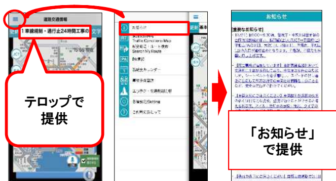
首都高専用の道路交通情報アプリ「mew-ti」