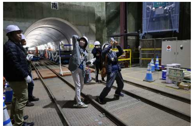
導水カードの枠を使って記念撮影