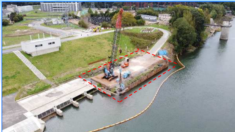
工事中の那珂樋管の取水口（赤枠が工事箇所）