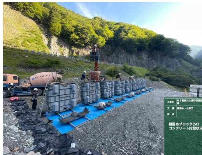
根固めブロック工 制作