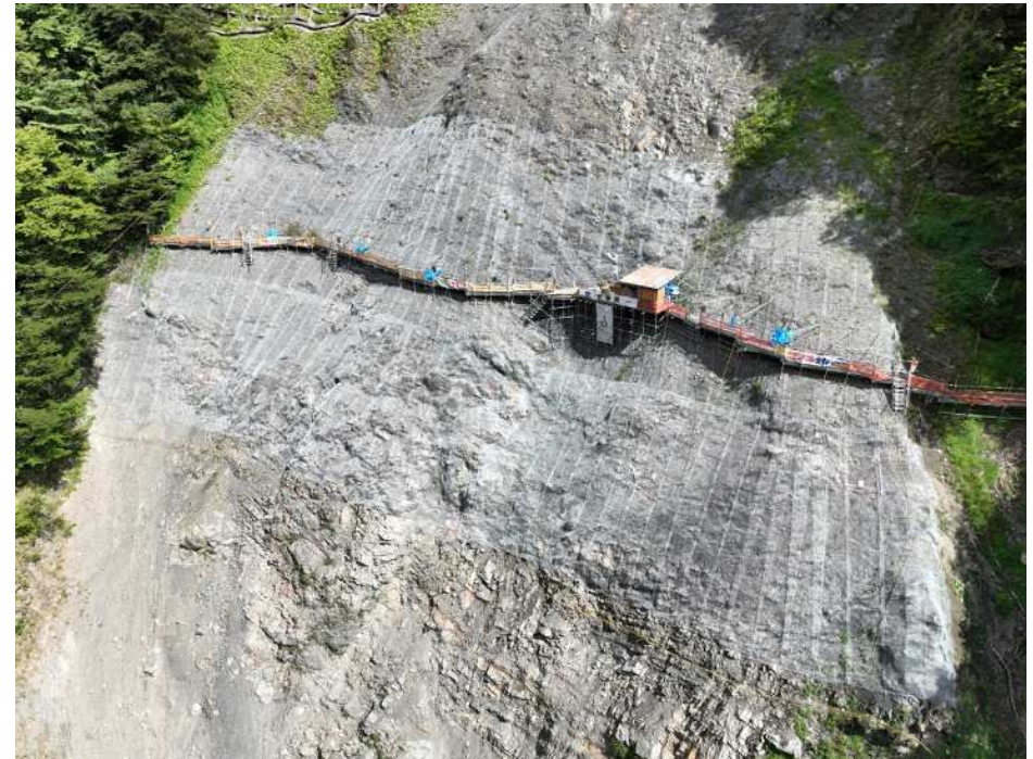
落石雪害防止工 設置完了

中島砂防堰堤の改築にあたり、支障となる右岸崩壊地からの落石対策を行う斜面对策工事。前年度工事から継続。現在、落石雪害防止工 設置完了。