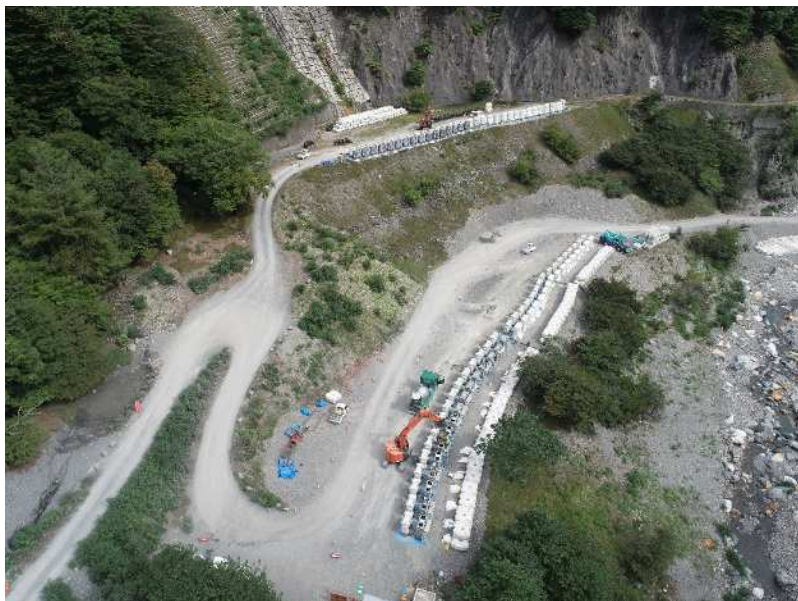
根固めブロック工 制作