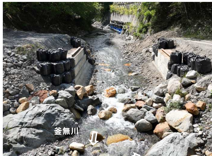
仮設工 仮橋・仮栈橋工 橋台設置完了 (副堰堤下流側 工事用道路)

既設空谷砂防堰堤に嵩上げ及びアンカー工を設置し、改築する工事。前年度から継続施工し、洪水・土砂氾濫被害を防止・軽減する。現在、仮設工（仮橋・仮栈橋工、砂防仮締切工）を実施中。