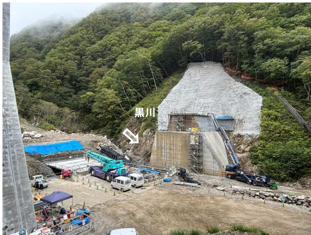
下流 右岸より本堰堤を望む（コンクリート堰堤工）