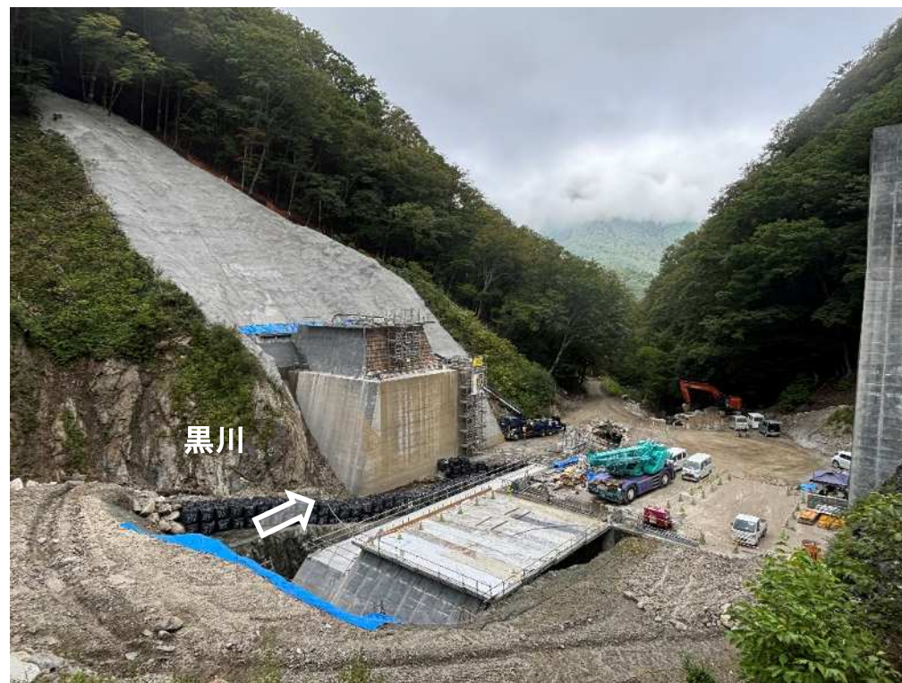
上流 右岸より本堰堤を望む（コンクリート堰堤工）

釜無川右支黒川において、土砂流出に伴う下流域での土砂・洪水氾濫の被害を防止・軽減するため、砂防堰堤を施工する工事。現在、コンクリート堰堤工 型枠工コンクリート打設工を実施中。