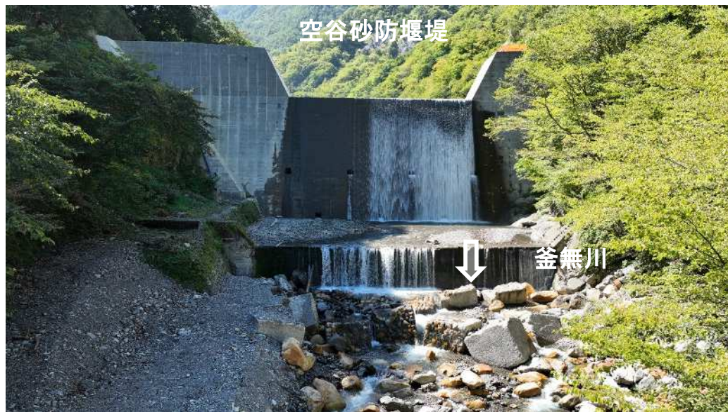
【着手前】下流より副堰堤を望む