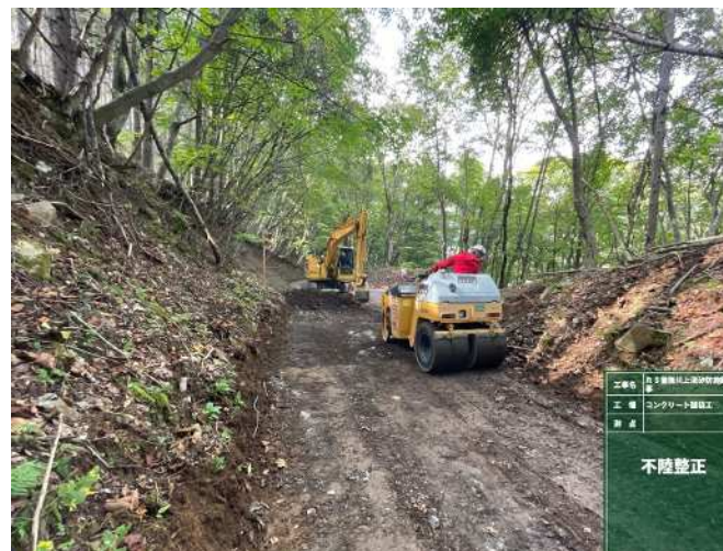
コンクリート舗装工 施工区間②