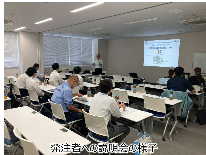
発注者への説明会の様子