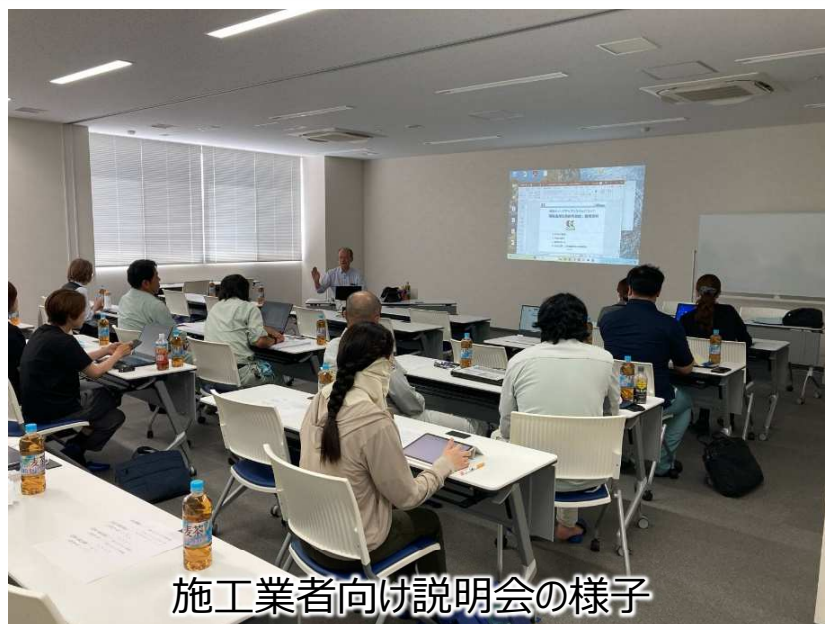
施工業者向け説明会の様子