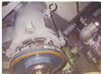
②既存エレベーター機械室 パワーユニット