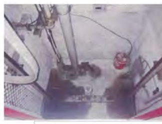
既存エレベーターシャフト内1