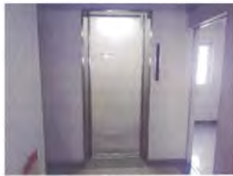
エレベーター正面