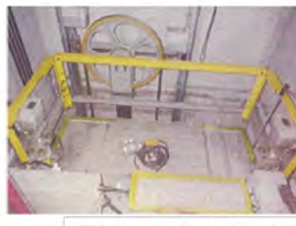
既存エレベーターシャフト内2