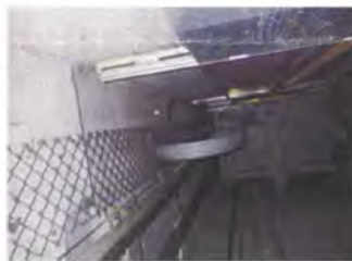
既存エレベーターシャフト内3