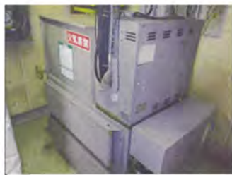
①既存油圧エレベーター機械室