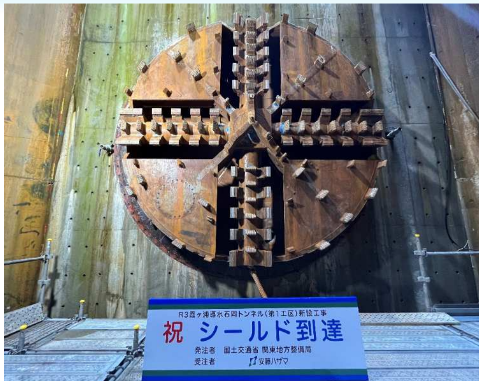
R3霞ヶ浦導水石岡トンネル(第1工区)新設工事 祝 シールド到達 発注者 国土交通省 関東地方整備局 受注者 安藤ハザマ