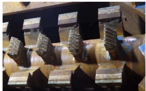
掘削ビット。摩耗したものの最後まで役割を果たしました。