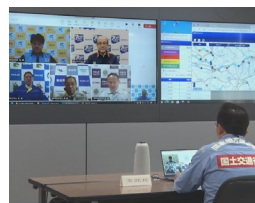
Webによる沿川自治体 とのホットライン訓練