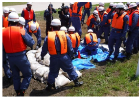
水防団による訓練 （月の輪工）