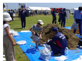
展示コーナー （土のう作り体験）