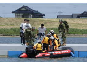
自衛隊と消防の協働 による孤立者の救助