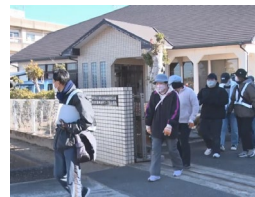
要配慮者利用施設避難 計画に基づく避難訓練