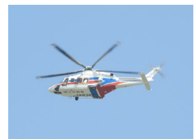
あおぞら号による 被災状況把握