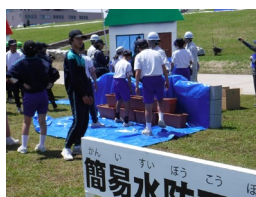
自主防災会等による 自衛水防訓練