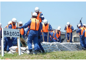
水防団による訓練 （積み土のう工）