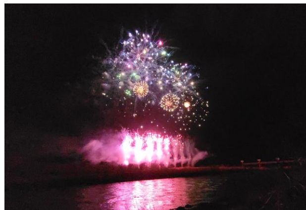
第15回辰ノ口さくら祭り(常陸大宮市) 花火大会の様子

春と言えば…みなさん「春の5K」はご存じですか？春特有で注意が必要な乾燥・花粉・黄砂・寒暖差・強風。つまり5つの頭文字「K」をとった総称だそうです。春は風が強く花粉や黄砂も飛びアレルギーが出やすくなり、また朝晩の寒暖差もあり体調管理がとても難しい季節です。私たちも日々の体調管理に十分注意し減災に向けた事業を進めていきますので、引き続き皆様のプロジェクトへのご理解ご協力を宜しくお願いいたします。