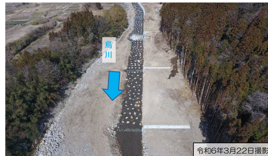
第四床固工 第15・16帯工