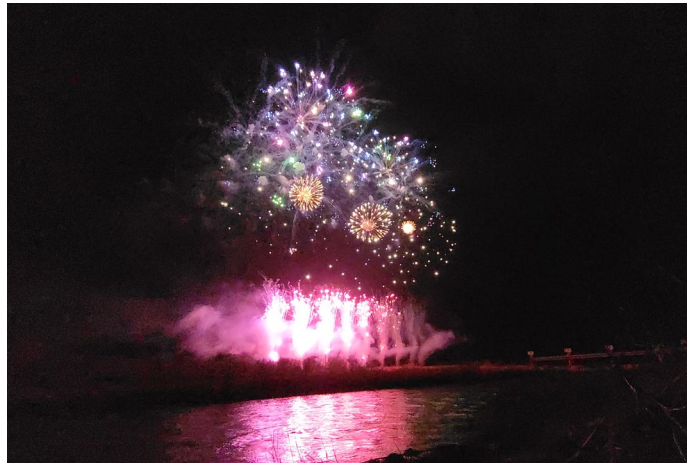
第15回辰ノ口さくら祭り(常陸大宮市) 花火大会の様子

春は風が強く花粉や黄砂も飛びアレルギーが出やすくなり、また朝晩の寒暖差もあり体調管理がとても難しい季節です。私たちも日々の体調管理に十分注意し減災に向けた事業を進めていきますので、引き続き皆様のプロジェクトへのご理解ご協力を宜しくお願いいたします。