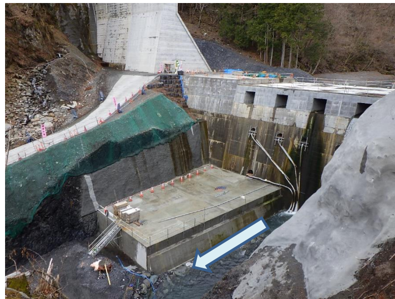
左岸下流側より望む