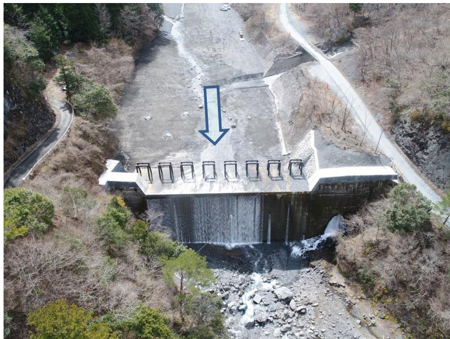
仲島工区 下流側上空より望む