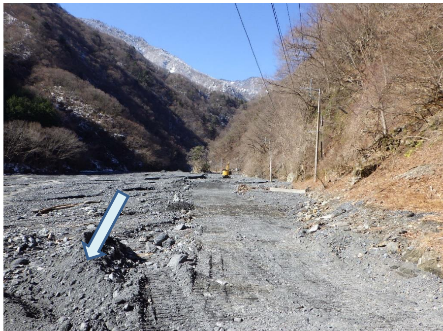
下流側より工事用道路復旧箇所を望む