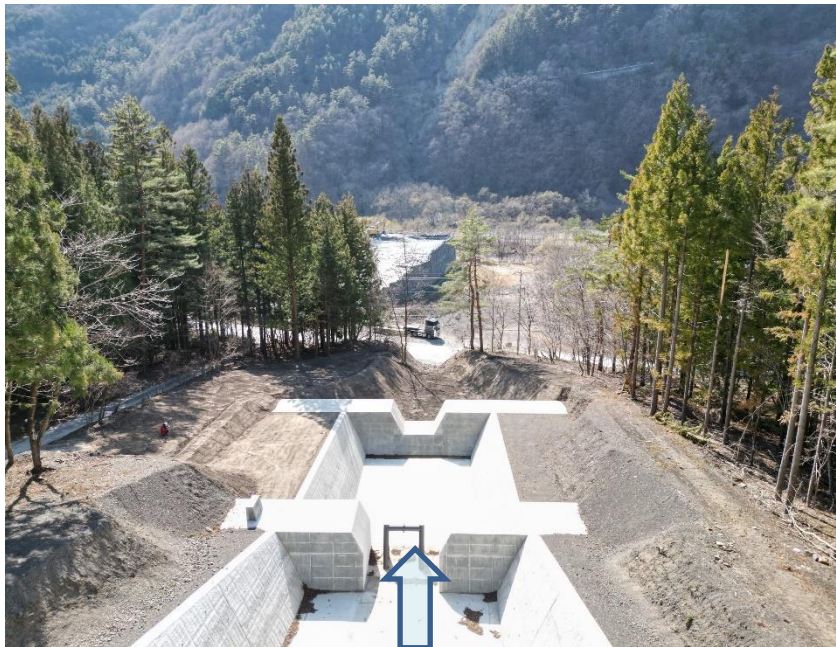
上流側より施工箇所を望む