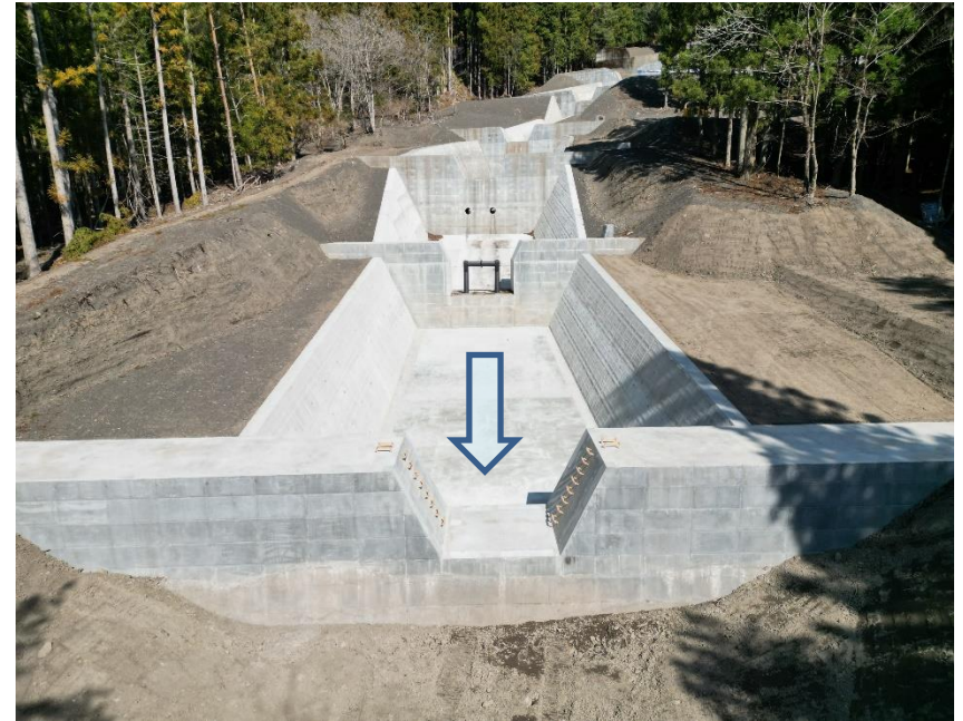
下流側より施工箇所を望む

本工事は、早川左支塩島沢において、土砂災害防止を目的とした砂防堰堤を施工する工事です。 現在、無事完成しました。