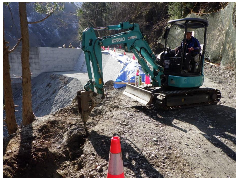
【擁壁設置箇所 掘削状況】

継続中であった砂防堰堤の整備と、上流域の砂防堰堤を整備するための工事用道路を設置する工事を行っています。