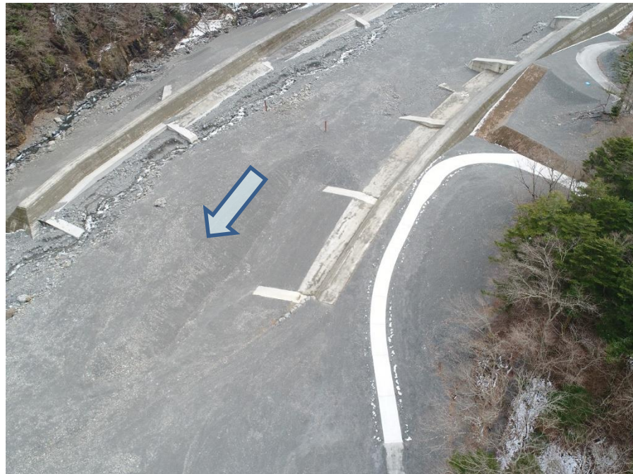
大春木工区 下流側上空より望む

本工事は、早川右支の春木川筋に設置されている既設の仲島砂防堰堤について、流木災害を防止するために、流木捕捉工を設置する工事及び早川右支川の春木川筋における既設の大春木床固群について、流路機能を維持向上させるため、改築を実施する工事です。現在、無事完成しました。