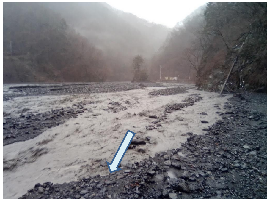
下流側より工事用道被災箇所を望む

稲又第三砂防堰堤の改築工事を行うための仮排水路を造る工事です。 現在、流失した工事用道路復旧作業中。