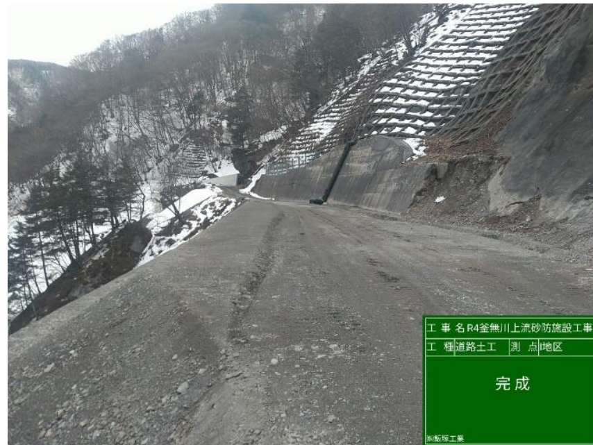
【完成】I地区：中島砂防堰堤下流

令和元年10月の台風による出水で被災した釜無川工事用道路の補修等及び中ノ川工事用道路において、コンクリート舗装工を実施する工事。工事完成。