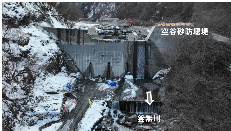
下流より本堰堤を望む（コンクリート堰堤工）