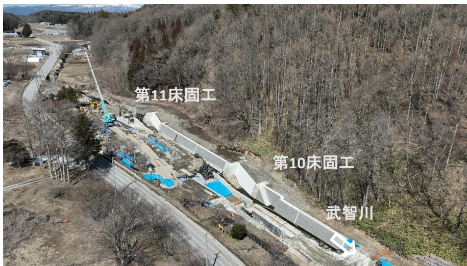
右岸上空より施工箇所を望む