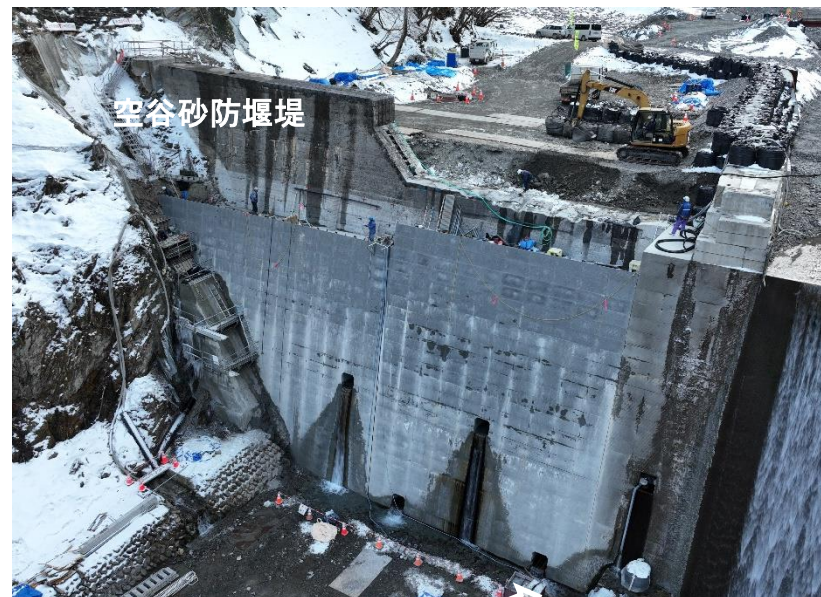
コンクリート堰堤（腹付け）施工状況

既設空谷砂防堰堤に高上げ及びアンカー工を設置し、改築する工事。前年度から継続施工し、洪水・土砂氾濫被害を防止・軽減する。現在、本堤のコンクリート堰堤（腹付け）を実施中。