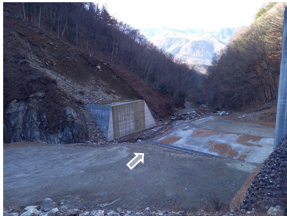
上流 右岸より本堰堤を望む（コンクリート堰堤工） （未着手）

釜無川右支黒川において、土砂流出に伴う下流域での土砂・洪水氾濫の被害を防止・軽減するため、砂防堰堤を施工する工事。現在、冬期間のため、現場閉鎖中。