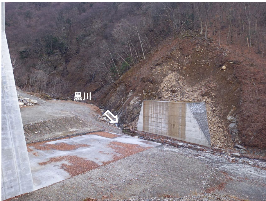
下流 右岸より本堰堤を望む（コンクリート堰堤工） （未着手）