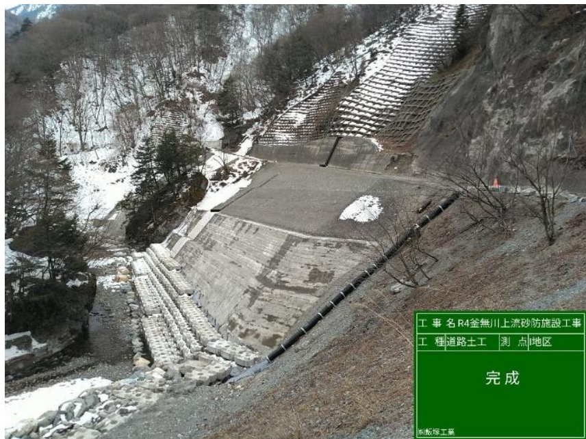
【完成】I地区：中島砂防堰堤下流