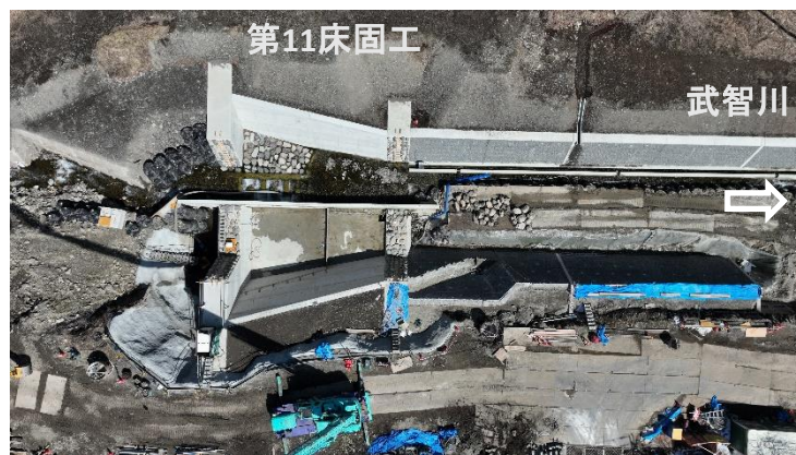
↑ 上空より施工箇所（第11床固工と流路護岸ブロック積）を望む

武智川下流床固群のうち、床固工、帯工及び護岸を施工し、土砂・洪水を安全に流下させ、土砂災害を防止する工事。左岸側の施工が完了し、現在、右岸側の床固工（第10、11床固工斜路工）及び流路護岸工を実施中。